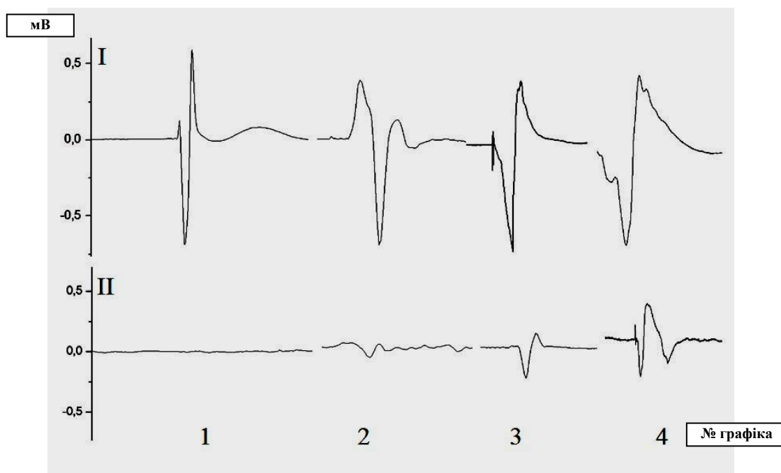
Рис. 1. Графік реєстрації проведення імпульсу на рівні дистального сегмента серединного нерва контрольної (I) і дослідної (II) кінцівки тварин. 1, 2, 3 і 4 – номер групи

У групі 2, тобто при невротомії та зшиванні нерва, на рівні дистальних терміналей травмованого нерва реєстрували поодинокі піки електричної провідності нерва на рівні 0,07 \pm 0,01 мВ, що відповідало 13,8% від контрольного показника контралатеральної кінцівки ( 0,60 \pm 0,04 мВ у контролі) (рис. 1, графік 2).