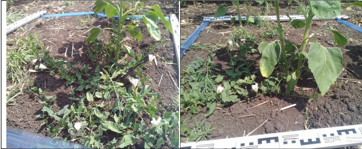
Рис. 2 – Вигляд облікової ділянки для підрахунку кількості бур'янів. Видно, що значна їх частина закрита від дистанційного спостереження листям соняшника

Облік бур'янів виконувався ваговим методом з урахуванням якісного складу бур'янів. Результати польових спостережень наведені у таблиці 1.