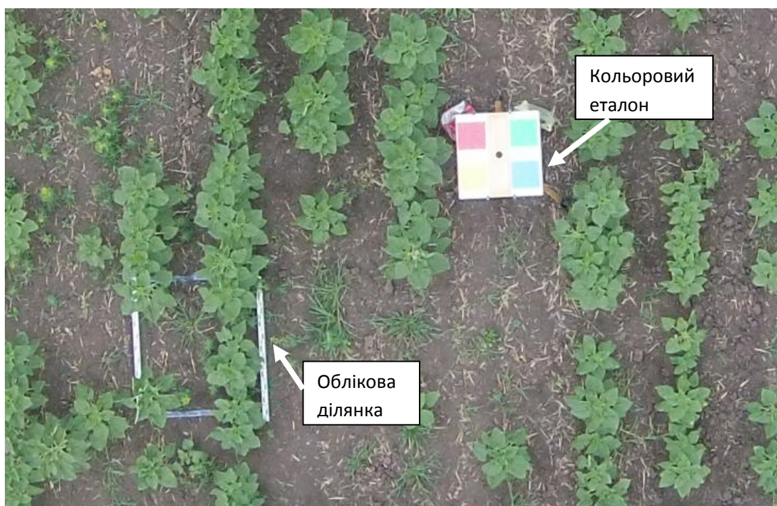
Рис. 1 – Фрагмент загального знімка досліджуваного поля (знімок з коптера DJI Phantom Vision 2+)

Для проведення обліку бур'янів традиційними польовими методами в протилежних частинах поля було створено дві облікові ділянки розміром 1x1 м. Поруч з ділянками на спеціальних штативах на висоті 1,5 м були встановлені кольорові еталони, призначені для врахування зміни освітлення під час зйомки (рис.1).