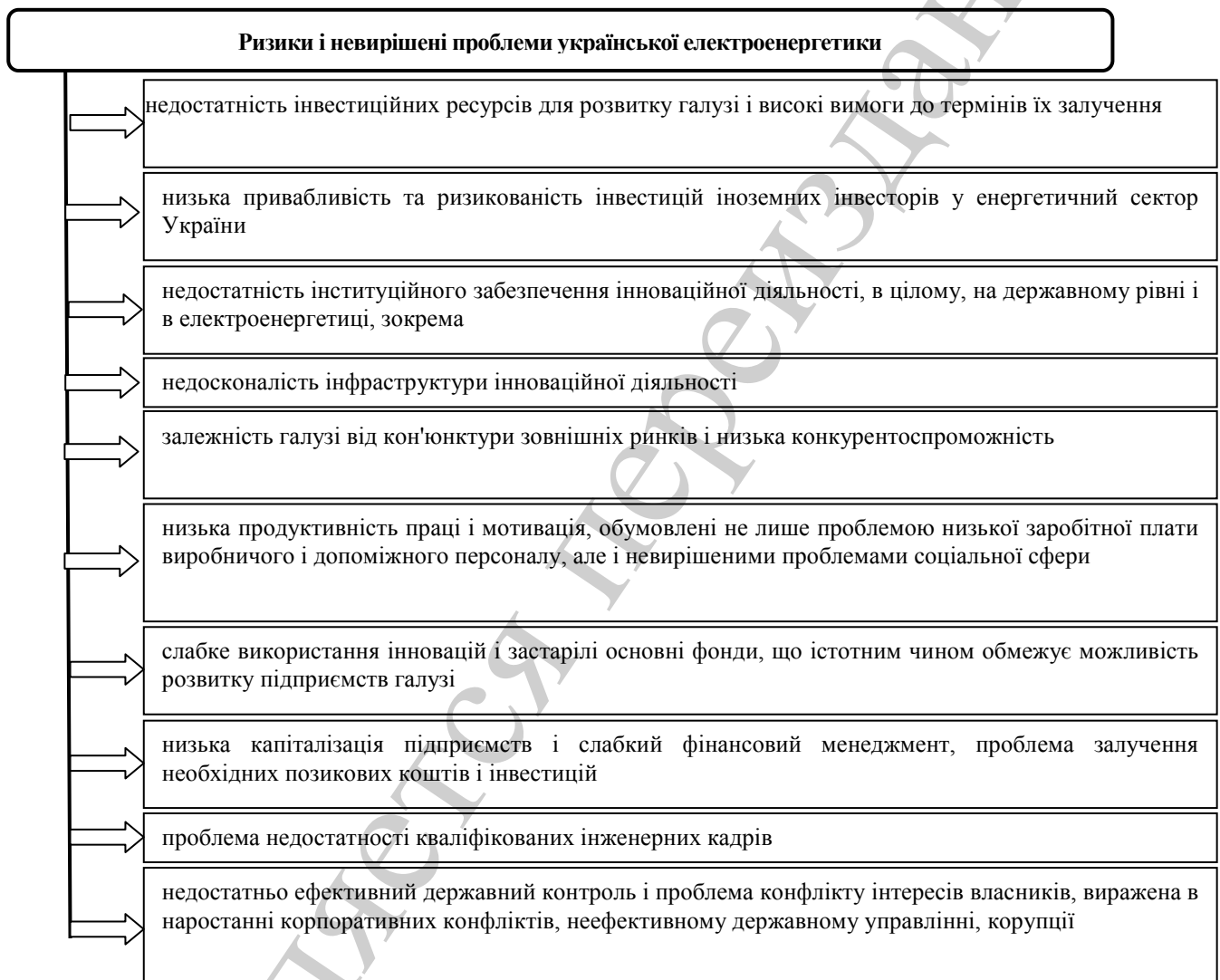
Рис. 2. Проблеми, що стримують розвиток електроенергетики України

Threats. Серед найбільш важливих ризиків і невирішених проблем української електроенергетики можна виділити наступні (рис. 3).