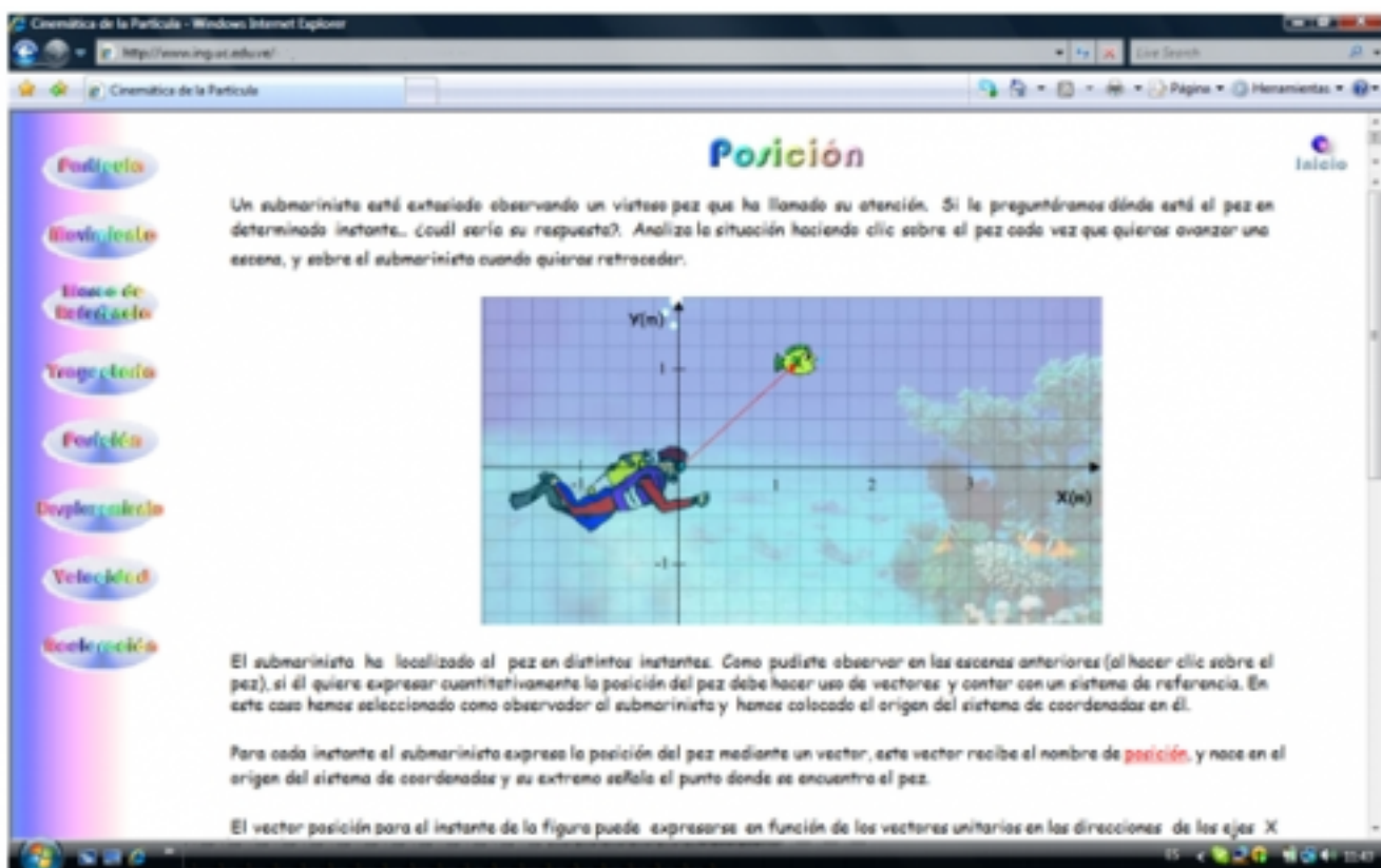
Fig. 1. Una de las pantallas del software (Posición)

Como instrumento de análisis, se realizaron encuestas y cuestionarios, donde se recopilaban datos acerca de las opiniones de los alumnos sobre el software; y tests de selección múltiple conformadas por una serie de ítems para evaluar al estudiante después de llevarse a cabo la experiencia propuesta.