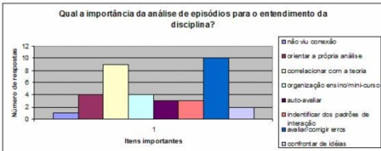
Gráfico 2 – Importância da análise dos episódios para o entendimento da disciplina.

A contribuição da avaliação da própria aula para a formação docente foi considerada positiva por vinte e nove (29) alunos. No gráfico 3 temos que a possibilidade de avaliar o professor é a maior contribuição da análise da própria aula. A interação professor/aluno, avaliar o planejamento, adequação da linguagem e a postura do professor são, respectivamente, as outras contribuições mais citadas pelos licenciandos. Mais uma vez observamos que os licenciandos concentram sua atenção na avaliação das ações do professor enquanto o planejamento e a organização do ensino uma contribuição menor para sua formação.