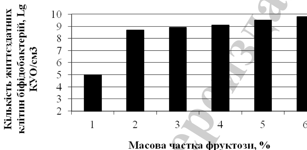
Рис. 1. Залежність кількості життєздатних клітин біфідобактерій у кисломолочних згустках у присутності фруктози: 1 – контроль; 2 – 0,1 %; 3 – 0,2 %; 4 – 0,3 %; 5 – 0,4 %; 6 – 0,5 %

В молоко додавали від 0,1 до 0,5 % фруктози за ТУ 9111-011-359-37677-02. Отриману суміш нагрівали до температури 40 °С, очищували, нагрівали до температури 65 °С і гомогенізували при тиску P=(15\pm 2) Мпа. Стерилізацію підготовленої суміші проводили при (121\pm 2) °С з витримкою (15\pm 5) хв., охолоджували до температури заквашування – (37\pm 1) °С, вносили закваску. Ферментацію проводили до рН 4,6–4,7, тобто до утворення згустку. Залежність кількості життєздатних клітин біфідобактерій від масової частки внесеної фруктози наведені на рис. 1.