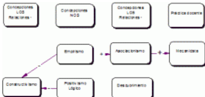
Figura 2b. Relaciones entre concepciones de NOS y LOS (profesor A).

Los indicadores obtenidos de la práctica del profesor dan cuenta de que las actividades didácticas que utiliza son mecanicistas ya que se basan en la relación asociacionismo – empirismo (tiene correlación negativa con el constructivismo). Puede afirmarse entonces que existe congruencia entre el enfoque asociacionista detectado en la entrevista y su práctica docente.