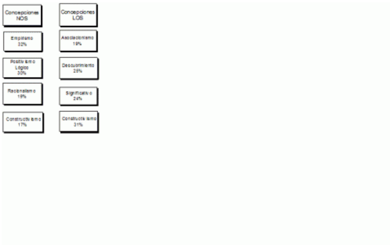
Figura 1. Porcentaje de respuesta de las concepciones de NOS y LOS.

En la figura 1 se muestra que un mayor porcentaje de profesores tiene una concepción constructivista del aprendizaje; en este caso el alumno es considerado un sujeto proactivo que interactúa con los contenidos programáticos y los interpreta de acuerdo a su experiencia, estructuras cognitivas y marco contextual.