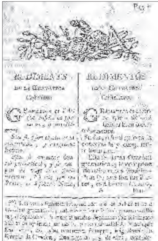
Figura 3. Primera pàgina de la «Gramàtica» de Salvador Puig, en sengles columnes: en català i castellà.

S’inicia la matèria definint-la: «Gramatica es l’Art que ensenya de parlar be, ò correctament», i al costat: «Gramatica es el Arte que ensenya à hablar bien ò correctamente». Defineix el seu objecte i les parts: «Nom, Pronom, Verb, Participi, Preposició, Adverbi, Interjecció, y Conjunció». I en la columna en castellà: «Nombre, Pronombre, Verbo, Participio, Preposicion, Adverbio, Intergección, y Conjunción», que aclareix i exemplifica a abastament en una nota a peu de pàgina. I ara passa a ocupar-se «Del Nom» / «Del Nombre», definint-lo —«Nom: es una part de la Oraciò gramatical, significativa de persona ò cosa, declinable per generos, numeros, y casos», i en castellà «Nombre: es una parte de la Oracion gramatical, significativa de persona ò cosa, declinable por generos, numeros,