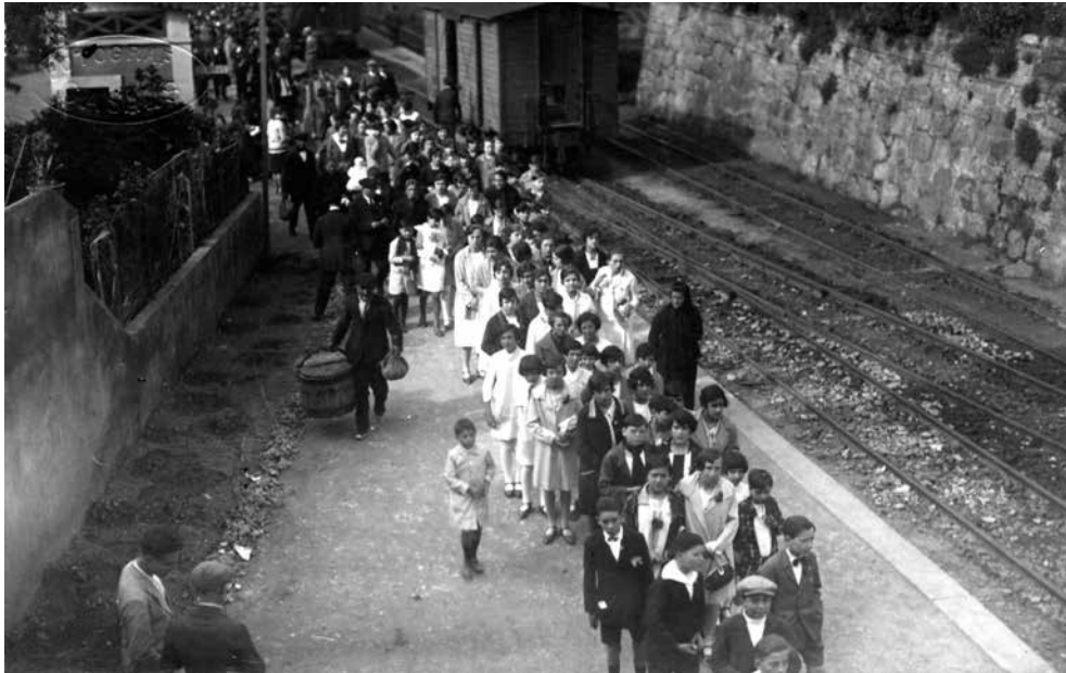
Arribada a Manresa l'any 1918 dels cantaires de Castellbell i el Vilar.

els veiem actuant en una fotografia de l'any 1945.