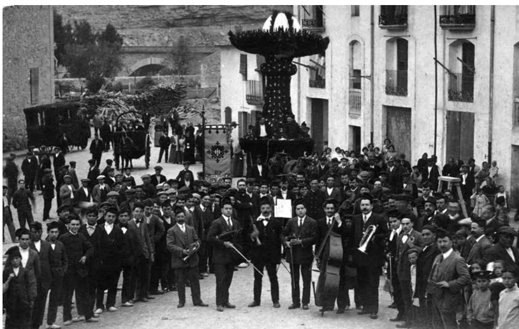
El cor del Burés en els seus orígens.

Notes històriques en record de la centenària tradició coral de Castellbell i el Vilar. Aproximació a les diverses societats corals, cors i orfeons que han donat veu a la història musical del poble i que enguany celebra el centenari de la Capella de Música Burés.