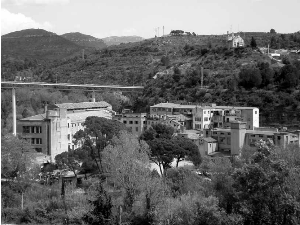
Punt on hi havia el molí batan 25

sembla indicar que l'afectació física va ser molt forta. El 1817 el gremi de teixidors de Monistrol demanà a la Junta de Comerç de Catalunya que els hi permetés copiar algun reglament ja que, per culpa de la guerra, s'havia arribat a perdre fins i tot el reglament del molí sense conservar-ne cap còpia en tot el poble 16 .