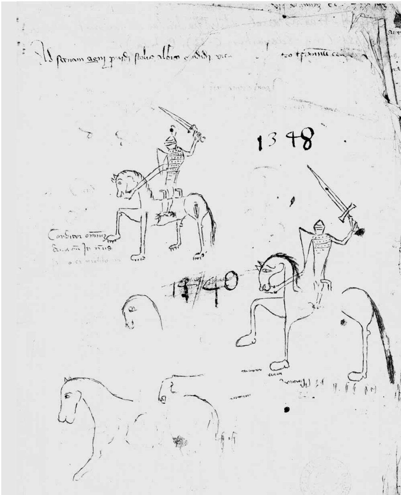
Entreteniment del notari esperant els clients