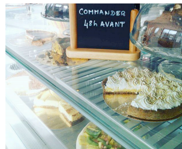
Fig. 2 – Modalità di esposizione dei dolci nelle sale da té considerate.

Les gourmands de St-Sernin