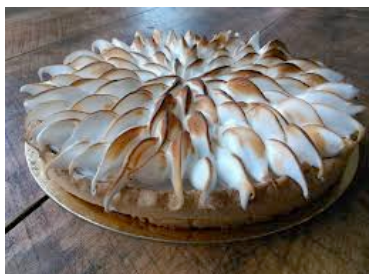
Les gourmands de St-Sernin ( https://lesgourmandsdesaintsernin.fr/ )