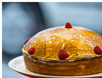
Salon d’Eugénie ( http://www.lesalondeugenie.fr/fr/ )

Le nostre sale da thé ne propongono diverse varianti. Bapz e Le salon d’Eugénie per esempio giocano sull’elevazione di uno strato omogeneo che ricorda la figura di una montagna. Les gourmands de St-Sernin mantiene invece la tecnica della ripetizione dei cespugli, ma dispone le punte verso il perimetro della torta, suggerendo un movimento centrifugo (FIG. 6). Con figure diverse, si tratta sempre di comunicare una forma di dinamismo che si oppone alla staticità, e dunque della pesantezza relative, delle componenti inferiori, sfruttando la tensione tra un polo aereo, in alto, e un polo terrestre, in basso, dove non a caso ritroviamo sapori minerali, come la sapidità della pasta.