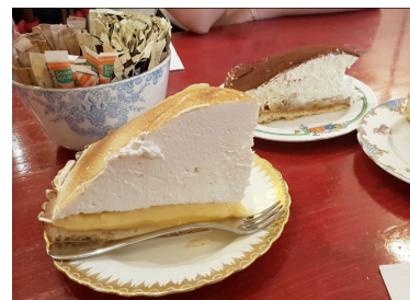
Bapz ( https://www.bapz.fr/ )