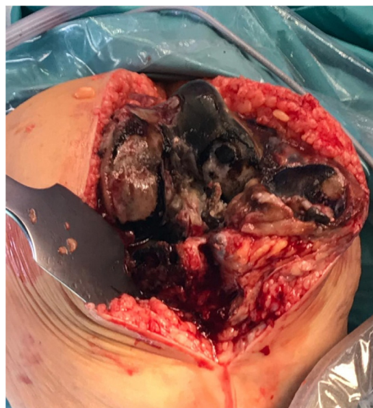
Figura 2 Apariencia intraoperatoria de los tejidos impregnados por el pigmento.

con cemento, sin necesidad de suplementos ni conos. Se tomó una muestra de sinovial que se remitió al departamento de anatomía patológica, que confirmó la ocronosis. Se realizó la técnica habitual utilizada en nuestro centro para prótesis total de rodilla PS, con infiltración de ropivacaína y adrenalina intraoperatoria según la técnica local infiltration analgesia , y sin drenajes. Durante el postoperatorio la paciente siguió el mismo protocolo de rehabilitación fast-track que utilizamos habitualmente en nuestro centro. Inició la marcha el mismo día de la cirugía y fisioterapia con movilidad activa asistida y ejercicios isométricos e isotónicos de fortalecimiento. Fue dada de alta al segundo día posquirúrgico. La herida curó sin complicaciones, y el balance articular mejoró a 0-0-110° sin dolor. A los 3 meses se realizó control clínico y radiográfico; la paciente negaba dolor y mostraba un balance articular de 0-0-120°, con correcta estabilidad de la articulación, con Knee Society Score de 85/100 y Western Ontario and McMaster Universities Osteoarthritis Index de 20. El control radiográfico convencional se completó con telemetría, mostrando