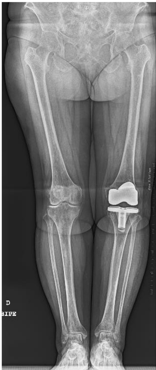
Figura 3 Radiografía postoperatoria.

una correcta alineación de la extremidad intervenida y una correcta posición del implante (fig. 3).