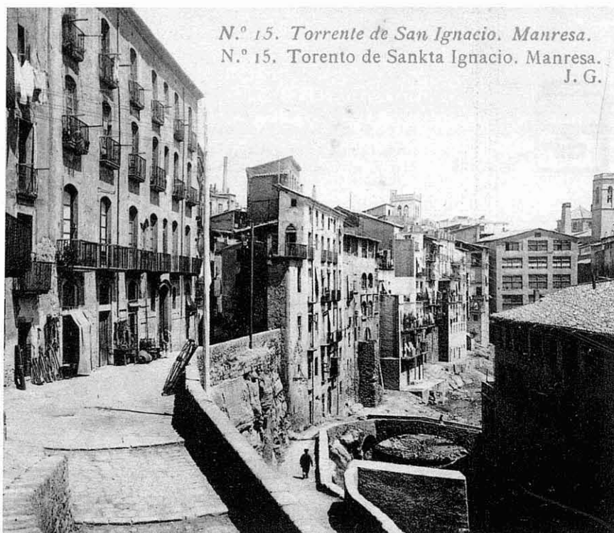
A l'esquerra de la foto, casa Asols, edifici del segle XVIII, que fou la primera seu del col·legi privat de 2 a Ensenyança de Mn. Josep Faura, inaugurat al 1869

Deixant de banda les vicissituds per les quals passà la segona ensenyança a l'edifici de l'antic Col·legi de Sant Ignasi, des que el centre es convertí per primera vegada en un col·legi de segona ensenyança l'any 1847, conegut indistintament amb els noms de Colegio Manresano , Colegio Privado de 2a. Enseñanza o Establecimiento Libre de 2a. Enseñanza , però conservant sempre el