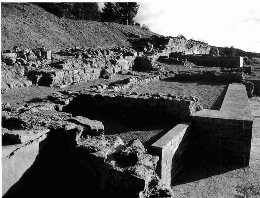
La vil·la romana de Sant Amanç (Rajadell) durant les tasques de restauració de 1998. (Foto: David Olivares).

En els darrers deu anys el nombre i l'entitat de les intervencions arqueològiques desenvolupades al nostre país i a les comarques de la Catalunya Central ha crescut molt respecte els anys anteriors. L'arqueologia cada cop més s'ha anat diversificant profundament, i la metodologia arqueològica ha anat participant en èpoques històriques que anys enrera no eren tan valorades, com l'època medieval, o bé eren inexistents en aquest sentit, com l'actual arqueologia industrial. En aquest article fem un recull d'intervencions arqueològiques que s'han fet a la Catalunya Interior els darrers anys, deixant a banda, és clar, les intervencions que estan descrites més extensament en els articles del dossier.