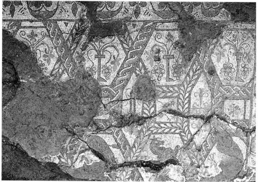
Detall del mosaic documentat a la vil·la romana de Sant Amanç.