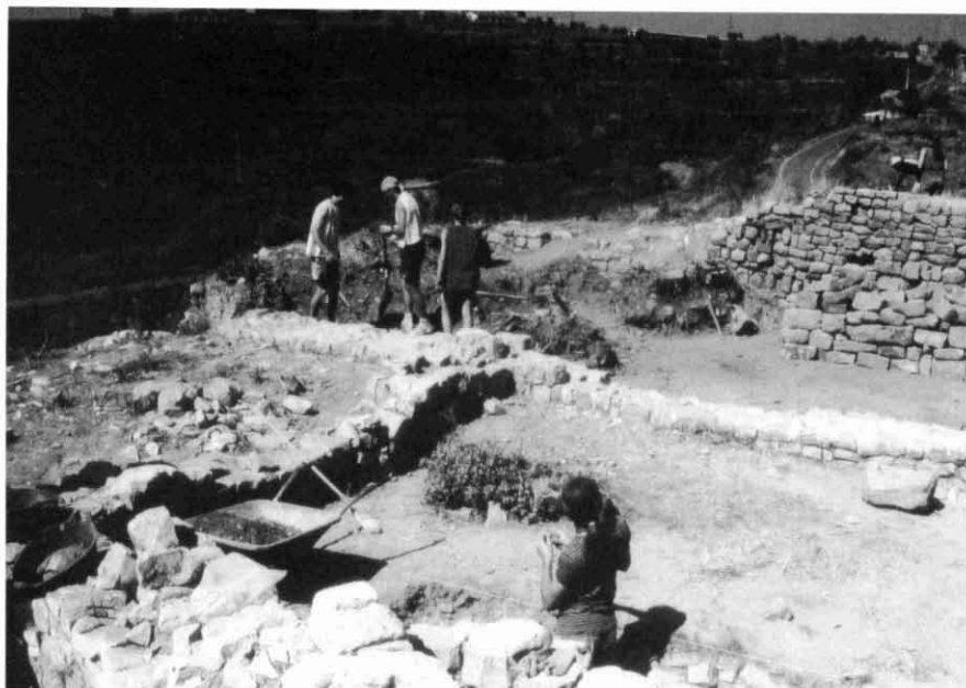
Camp de Treball Arqueològic de 1996 al Castell de Sant Mateu.

uitar possibles problemes generats per l'acumulació de runa a l'exterior, que empenyés les parets cap a dins, l'any 1993 es procedí a la neteja de l'exterior. Aquesta neteja deixà al descobert un segon habitacle adossat al mur de migdia del presbiteri, edifici que mesurava 5 per 4 metres. L'observació del parament dels murs de l'església permetia observar-ne dos tipus, així com les traces d'un hipotètic moviment sísmic que hauria alterat alguns dels murs.