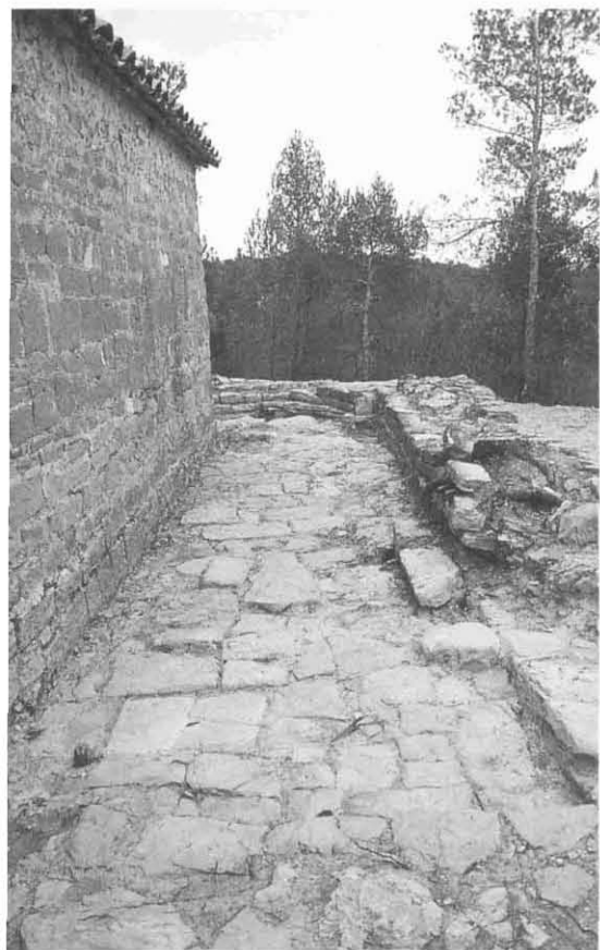
L'església de Sant Salvador del Canadell durant la intervenció. (Foto: Josep Maria Vila).

intervencions de tot tipus, ja que hi ha intervencions que afecten jaciments de totes les èpoques, des de la prehistòria fins a les èpoques més recents, passant pel món ibèric, romà o l'època medieval. De la mateixa manera la tipologia de les intervencions és prou diversa, ja que hi trobem excavacions d'urgència, seguiment d'obres públiques, camps de treball, documentació d'estructures datables en els segles XVIII-XIX, etc. Això mostra la notable importància que té l'arqueologia en el context de la investigació històrica i arqueològica, intervenint en tots els àmbits.