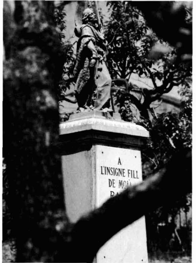
(A l'esquerra) Escultura a Rafael Casanova a Moià.

com jo. Això, en aquests darrers anys, s'ha fet notar en tots i cadascun dels municipis del Moianès. Els que teníem una tradició turística, ara la tenim més diversa pel que fa a la procedència social, i els que no en tenien ara en tenen.