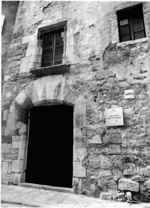
(A la dreta) Casa natal de Rafael Casanova a Moià.