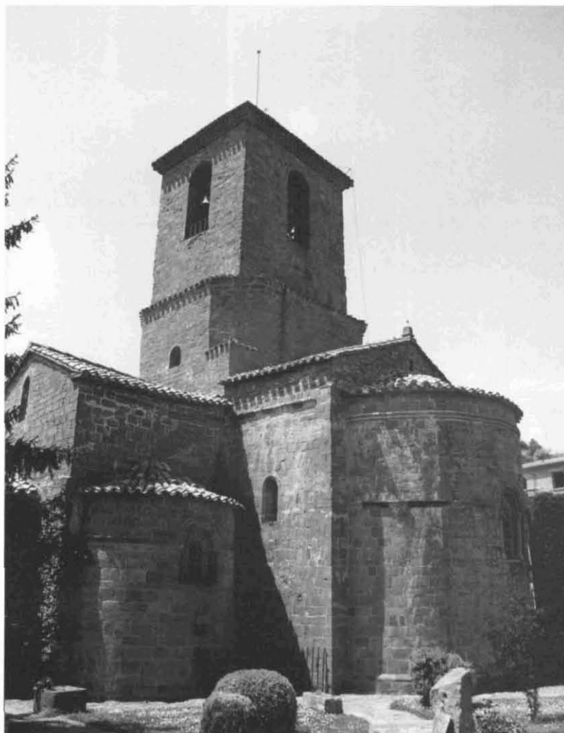
El monestir romànic de Santa Maria de l'Estany, famós pel seu claustre. (Foto: S. Redó).