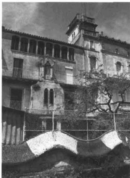
Casal modernista de la colònia de vacances de Moià.

— Quina és la col·laboració de l'estament privat? El professional s'ho creu això del turisme com a indústria, o el