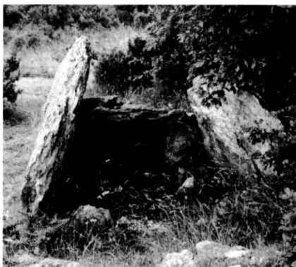
El dolmen del pla del Cuspinar, fàcil de localitzar i accedir, presenta un bon aspecte.

Finalment el dolmen del Pla de Trullàs , a Monistrol de Calders, tot i que de proporcions considerables, està en estat ruïnós. Està ben senyalitzat, ben preservat i és prou popular, ja que forma part d'itineraris de caminades