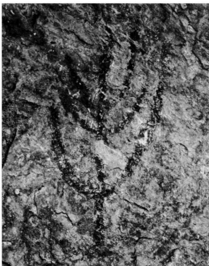
Pintura esquemàtica d'una cova d'Alòs de Balaguer. (Segons Maluquer).

Més al sud, una altra vall tributària del Cardener, la de la riera de Rajadell, aporta dues mostres importants de megàlits. El menhir de Cal Giralt , a Aguilar de Segarra, és al mig d'un camp a tocar la cruïlla de les antigues carreteres a Fonollosa i Rajadell, aquesta substituïda ara per l'Eix Transversal. El menhir era a terra i els anys 20 fou aixecat per Mn. Santamaria. L'altre exemplar és el dolmen de Cal Marquet de Grevalosa situat sobre les terrasses damunt la riera de Grevalosa. Actualment és el més ben conservat del Bages. Com tants d'altres fou