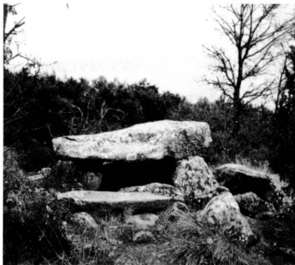
El dolmen del Puig-Rodó és un exemplar emblemàtic del qual no se'n té prou cura.