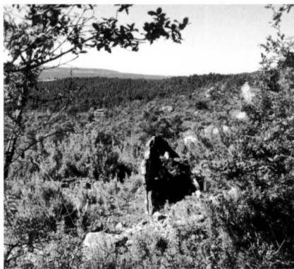
El que en queda de la Barraca dels Moixonaires. Al llibre La civilització megalítica a Catalunya , Serra i Vilaró en publicà una foto en què el dolmen feia prou goig.

La gran zona megalítica de Cardona era el pla de Bergús . Pujant per la carretera del Miracle, trobem en primer lloc el dolmen de la Coma de Fontelles . D'aquest en queden quatre pedres amuntegades i colgades per l'herbam davant de la Creu de la Llor-della. Ens consola el fet que no ha estat destruït recentment, sinó que ja ho estava totalment quan l'estudià Serra i Vilaró. Just enfront d'aquest, a l'altra banda de la carretera, surt l'antic camí de Bergús a Cardona. Reculant per la pista, arribem al Mercat de Calaf, petit coll i esplanada a la carena de l'Obaga Negra. Allà, una mica enfilat a mà dreta, hi ha les restes de la Barraca dels Moixonaires . Dos petits trossos de llosa clavats en angle recte és tot el que queda del que segurament fou el dolmen més important de Cardona. També els anys 20 o 30 fou destruït per a fer-ne grava.