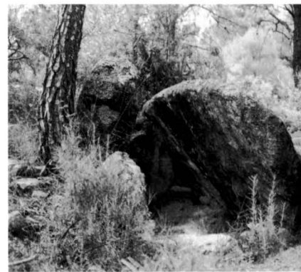
La Tomba del Moro del Serrat de les Moles a Vallbona de Torroella. El seu aspecte actual és el mateix que fa 80 anys.

Cardener avall, arribem a Torroella (Palà, Valls, Sant Salvador). És un territori repartit entre Navàs i Sant Mateu de Bages però que per a nosaltres forma una unitat força natural. Aquí hi ha dos megàlits. El dolmen de les Comes , quatre pedres mal comptades, que tot i ésser a tocar el camí i en un lloc on els cotxes hi poden arribar i aparcar fàcilment, està tal i com el deixà Serra i Vilaró quan l'excavà els anys 20. El que passa és que llavors ja no hi havia més del que hi ha ara. Segurament la presència d'un modest cartell anunciant que es tracta d'un dolmen hagi estat la seva salvació. L'altre és el dolmen de la Tomba del Moro del Serrat de les Moles de Vallbona . Es tracta de l'exemplar més gran de tot el Bages –exceptuant potser el del Pla de Trullàs, que està en molt més mal estat– i el que té les lloses de pedra més impressionants. La llàstima és que la coberta va desaparèixer totalment. Pel lloc molt desavinent on està ubicat, el