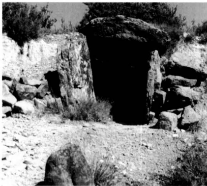
El dolmen de Can Pregones a Sallent, un bon exemple d'una actuació per a conservar-lo.