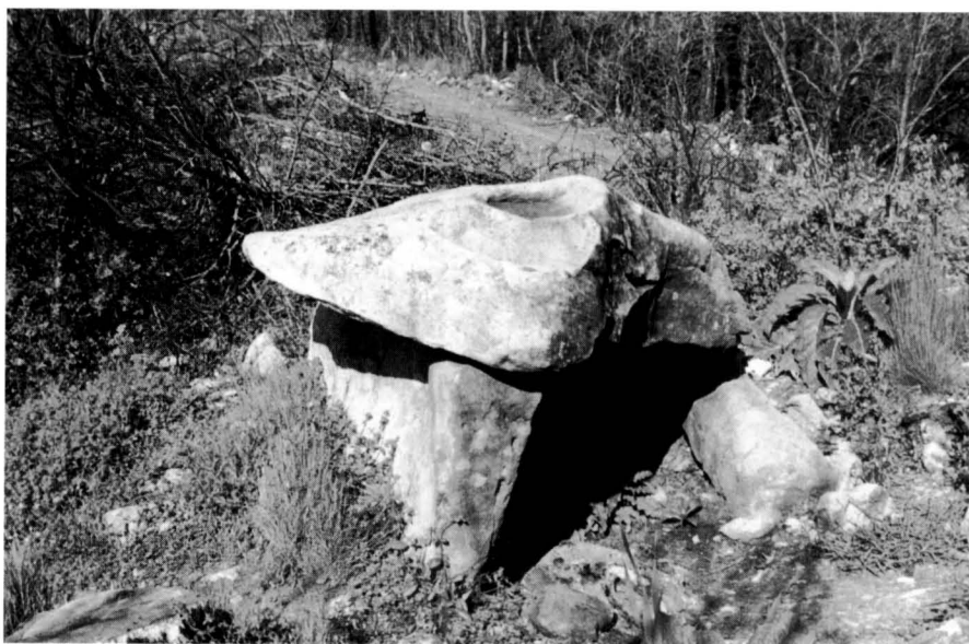
El dolmen de Castelltallat en l'actualitat.

Joan Maluquer de Motes a "Les pintures rupestres" del volum 1 de la Història de Catalunya (ed. Salvat) a la pàg. 42 a hi mostra la foto d'una pintura esquemàtica d'una cova d'Alòs de Balaguer que té l'aspecte d'un canelobre de set braços. La part inferior –est– de les inscultures de la llosa dels Tres Tossals recorda tal vegada una espina de peix, o potser els nervis d'una fulla ampla –com un gran pàmpol–, una