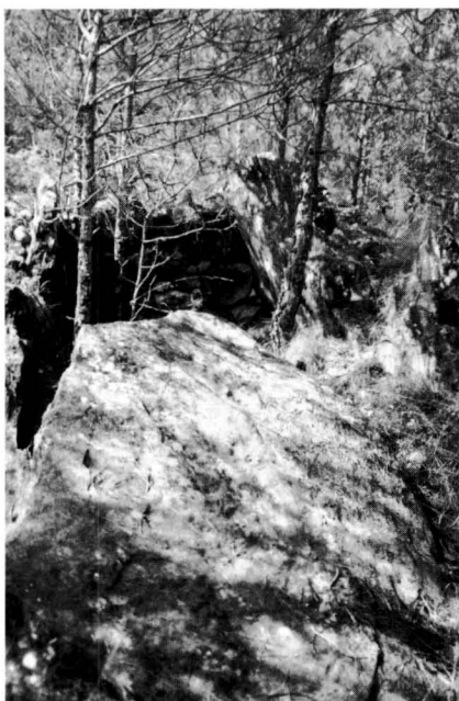
El dolmen de Sant Salvador, prop del Molí Nou a l'Aigua d'Ora.

Un tros més amunt, passat Sant Salvador, i remuntant el curs de l' Aigua d'Ora per la pista que pel seu marge dret porta cap a Sorba, trobem, una mica abans del Molí Nou, el dolmen de Sant Salvador . El seu estat és deplorable, i molta gent del país no sap ni que allò fos un dolmen, ja que havia estat adaptat com a barraca de vinya. La llosa més gran, que cap els anys 20 era dreta, ara jau trencada a terra.