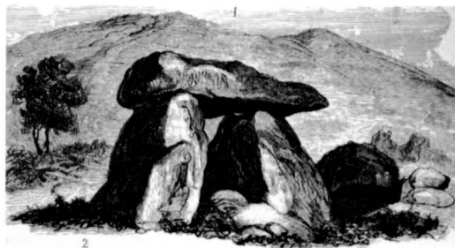
Dibuix del dolmen de la Grossa aparegut a la Historia General del Arte de Lluís Domènech i Montaner.

terrenys on s'aixequen. Trobem casos de deixadesa total —malauradament massa freqüents pel nostre gust— i casos de sobreprotecció —molt pocs— que fins i tot impedeixen accedir a menys de 100 m. del monument sense els permisos adients (cas de Pins Rosers a Llinars del Vallès, situat al recinte "fortificat" de les Aigües Ter-Llobregat que abasten Barcelona).