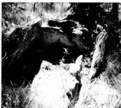
(A sota) La Fossa del General. Aquest dolmen s'havia considerat sempre del Solsonès quan en realitat pertany al Bages.

sants de la nostra comarca pel seu bon estat de conservació i per les seves proporcions elegants, ensems que de majestuosa fortitud.” 3