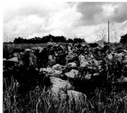
El dolmen de can Parés és, de bon tros, el més deixat dels del Moianès.