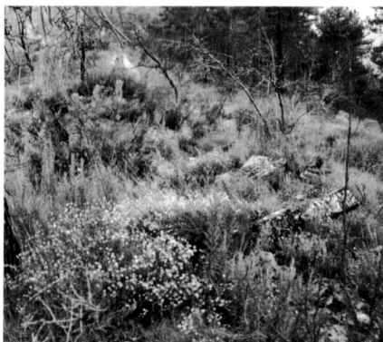
(A dalt) El dolmen de Coaner. De la cambra només en queden trossos trinxats de lloses escampats pel damunt del túmul.