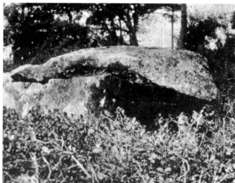
El dolmen de Castelltallat quan fou excavat els anys vint. (Segons V. Santamaria).

Sembla ser, per l'ús del passat –"era"– i per informacions de la casa de la Figuera –que col·laboraren amb Mn. Santamaria en l'excavació– que la llosa nord, actualment trencada, es fracturà durant l'excavació, de forma