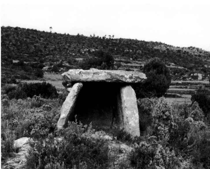
El dolmen de cal Marquet de Grevalosa és actualment el millor exemplar del Bages.

L'únic dolmen en condicions d'ésser visitat actualment a la vall del Llobregat és el de can Pregones . És d'accés fàcil i fou restaurat i decentment conservat per la gent de Sallent que en aquest sentit són un exemple a seguir.