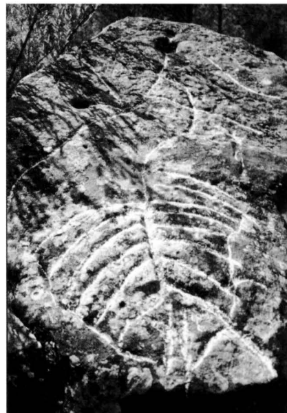
Gravats de la llosa de coberta del megàlit dels Tres Tossals.