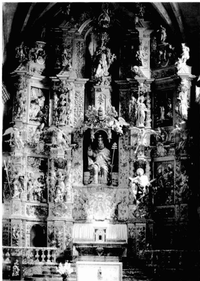
2. Retaule major de l'església de Sant Pere de Prada del Conflent, obra de Josep Sunyer, construït entre els anys 1696 i 1699.