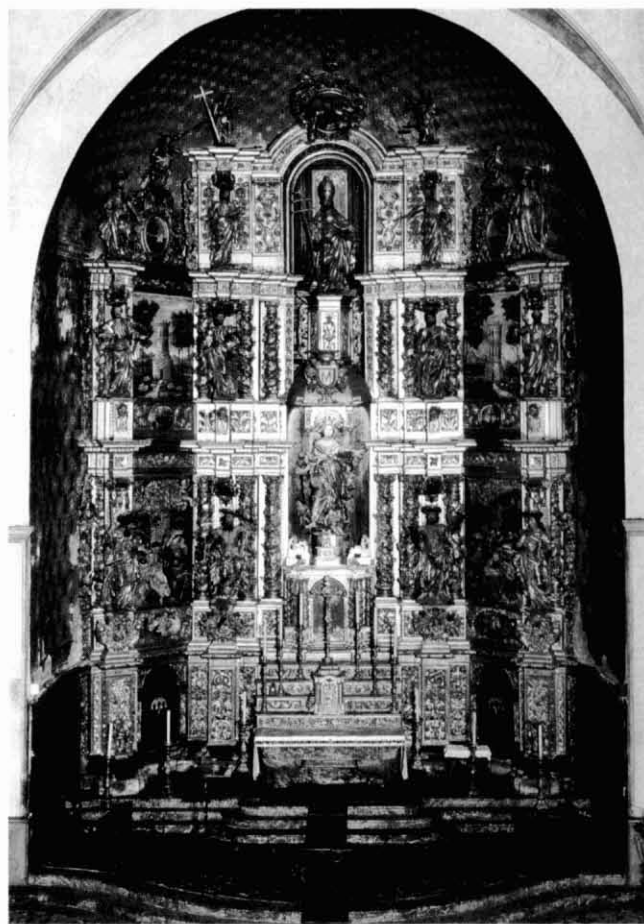
3. Retaule major de la Mare de Déu dels Àngels de Cotlliure (1698-1702).