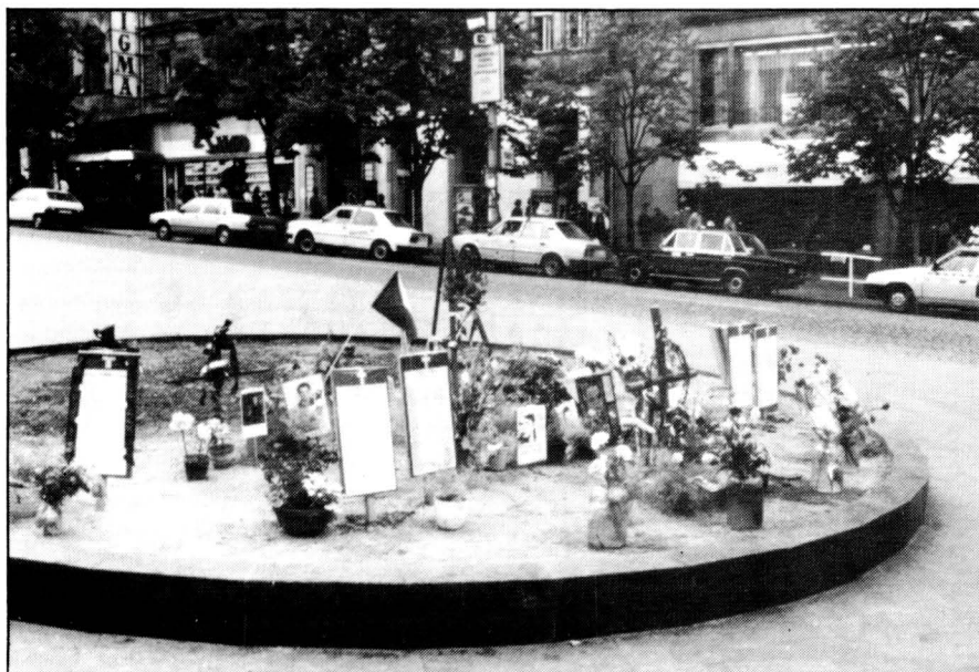
Ofrenes populars en recordança a les víctimes de la Primavera de Praga del 1968.

s'intenta que aquestes reflexions tinguin un punt de referència, l'evolució seguida per l'Europa occidental en aquest mateix període de temps. Crec oportú mantenir aquesta referència perquè és justament el «mirall» de l'Europa occidental i el «mite» de les bondats de l'economia de mercat el que sembla haver donat l'impuls definitiu als pobles i als dirigents d'aquests països per abandonar el que, segurament de forma incorrecta, s'ha anomenat durant dècades el «socialisme real» i per intentar la transició cap a un sistema de llibertats democràtiques i de mercat homologable al que coneix l'altra meitat d'Europa. Ací, precisament, apareix, al meu entendre, el primer punt que