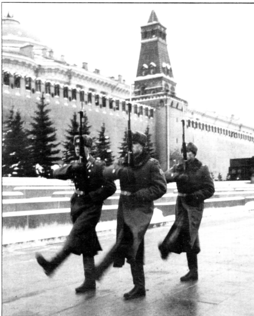
Canvi de la Guàrdia a la tomba de Lenin. Moscou, 1988.