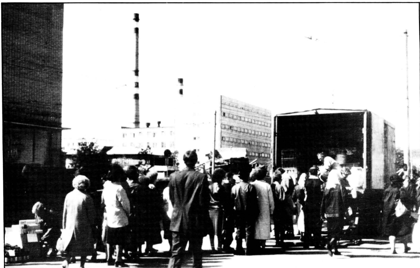
Cua en un camió de proveïment a Murmansk (Federació Russa) el 1992.

iniciativa pública sota l'anatema que és una pervivència del passat. Això seria ignorar, com deia al començament de la meua intervenció, que el capitalisme de «rostre més humà», amb totes les seves imperfeccions i limitacions, el denominat «estat del benestar» de l'Europa occidental, es caracteritza, com recordava recentment a El País Maurice Duverger, per l'existència d'un important sector públic, no necessàriament poc competitiu o deficitari, i per l'actuació d'un Estat que garanteix, encara que sigui parcialment, els drets bàsics de la població: ensenyament, sanitat, habitatge, cobertura de l'atur, jubilació, etc.