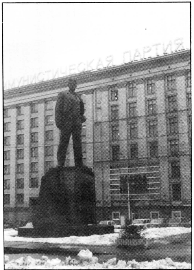
Monument a Maja Kovski davant la seu del Partit Comunista. Moscou.