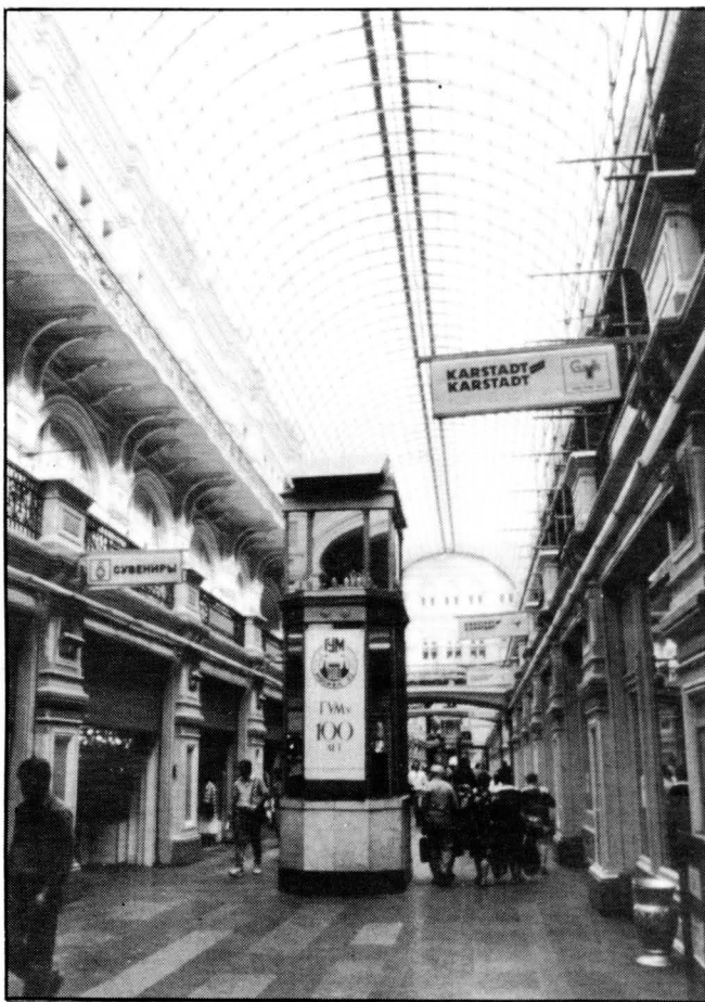
Els famosos Magatzems GUM, construïts a finals del segle passat i transformats en comerços estatals el 1921. Moscou.

Per situar en la seva veritable mesura el «pes» de l'URSS com a segona potència mundial convé retornar a la situació que es configura després de la II Guerra Mundial, ja que el món que sorgeix amb la capitulació d'Alemanya i Japó (1945) és un món molt diferent del que existia abans de 1939. La multipolaritat de les potències (Alemanya, Gran Bretanya, EUA, URSS i, en menor mesura, França, Itàlia i Japó) ha donat pas a un món bipolar on, en el decurs