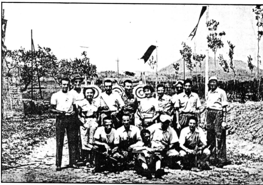
Membres de «Arqueros del Manresa» i del Club d'Arquers de Sabadell en una tirada realitzada al Congost.

Des del seu inici com a club esportiu, Arqueros del Manresa no havia disposat, però, d'unes instal·lacions prou adequades a la pràctica del tir amb arc, realitzant les seves tirades en un camp cedit inicialment per l'Ajuntament de manera provisional. L'any 1954 el club pogué disposar d'un nou camp de tir, també al Congost, en el lloc on anys més tard s'instal·laria el camp de tir olímpic de Manresa. Aquest nou camp, més ampli i millor equipat,