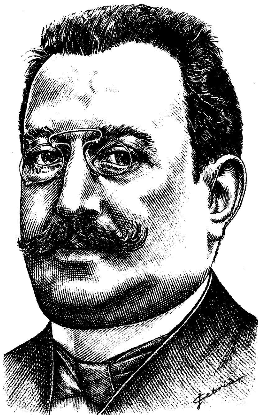
Enric Prat de la Riba. Secretari de la Unió Catalanista i de l'Assemblea que aprovà les Bases de Manresa.

Remarca, així, l'extremada juvenesa de Prat, qui tan sols comptava amb poc més de vint-i-un anys i ja era secretari de la Unió Catalanista, i que exercí com a tal en la mesa que presidí l'Assemblea, essent aquest el punt de partença d'una dilatada carrera política que el menà a promoure i presidir fins a la seva mort la Mancomunitat de Catalunya