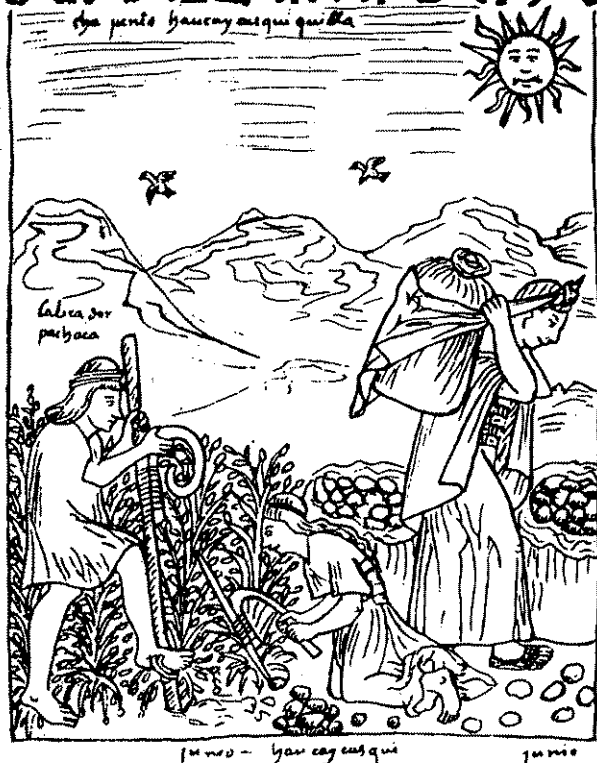
"TRAVAXOS / (el tiempo del turno de la cava de papa) / junio / (mes del descanso de la cosecha) / labrador / junio" (WUAMAN PUMA) Collita de la patata als Andes.