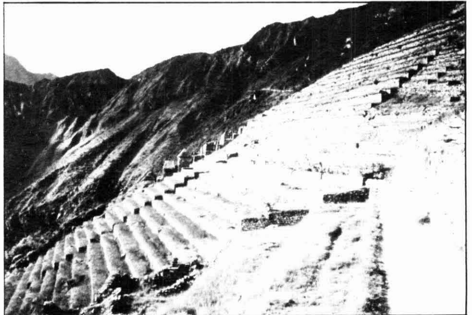
Machu Picchu, exemple de terrasses d'aprofitament agrícola inques.

Nogensmenys, la dimensió productiva o econòmica ha estat objecte d'un reconeixement molt més tardà i recent, mentre la perspectiva ambiental ha romàs ben bé bandejada de la gran massa d'estudis realitzats fins ara, de forma que la reinterpretació de la història ambiental americana, això és, la història de les relacions entre els sistemes naturals i les activitats humanes d'ençà del moment de l'encontre, permet bastir un major nivell d'integralitat i de sistematicitat per a la comprensió de la història americana.