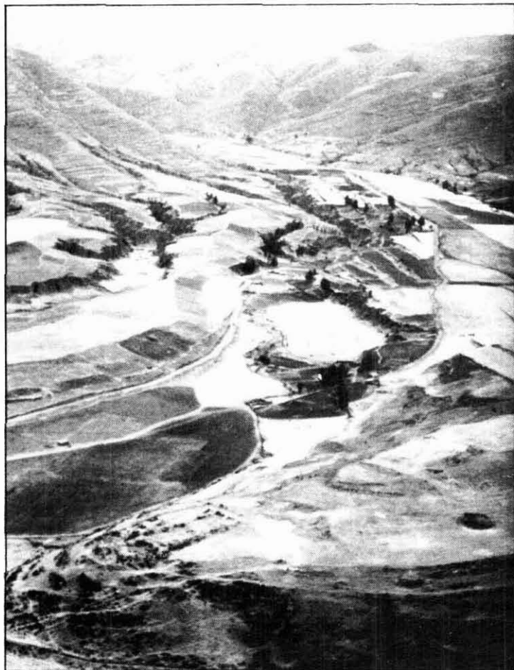
Exemple de la "verticalitat" agrícola als Andes

Abans que hi arribés Pizarro, els inques havien aconseguit un estat molt organitzat que es basava en una articulació entre les jerarquies locals - l'ayllu- i les superiors d'una administració central amb funcionaris al servei de l'Inca. Enmig, els curaques feien de nexa entre els dos nivells. Per dur a terme el seu model d'estat, els inques disposaven d'artesans especialitzats, creaven vies de comunicació, movent així poblacions senceres, i preparaven un sistema social cada cop menys dependent dels contextos ecològics locals, tal com va assenyalar John Murra (1978). D'aquesta manera, l'imperi inca s'havia convertit en una realitat econòmica i social organitzada a l'entorn d'un sol centre el poder del qual i, alhora, la seva fragilitat eren únics: un equilibri complex i delicat que la invasió europea trencà ràpidament i irremissible.