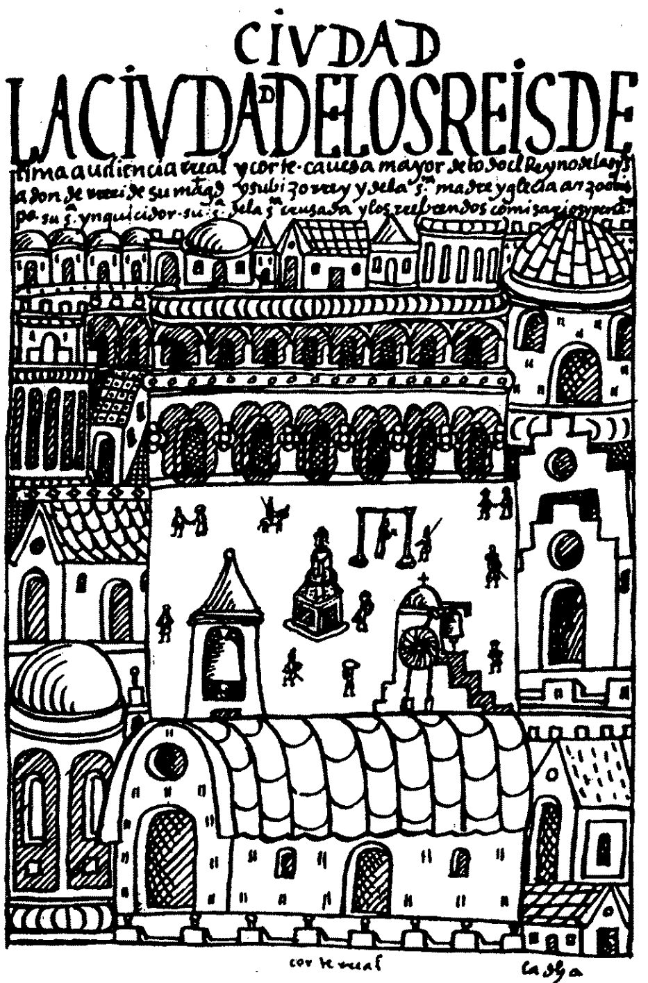
" / CIVDAD / LA CIVDAD DE LOS REIS DE Lima, audlencia rreal y corte, cauesa mayor de todo el rreyno de las Yndias adonde rrecide su Magestad y su bizzorrey y la santa madre yglezia, arzobispo su señoría de la santa crusada y los rrebrendos comisarios y perlados. / corte rreal". (WUAMAN PUMA)