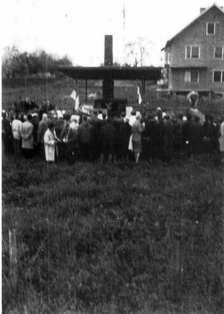
Acte d'homenatge al Crematori de Gusen, el mes de maig de 1964

El fet que darrerament els mitjans de comunicació dediquessin a aquesta efemèride un gran desplegament informatiu, fa palesa la importància que els fets relacionats amb la darrera confrontació mundial tenen encara per a la societat d'avui; no tan sols com a recordatori d'on pot arribar la barbàrie dels homes quan obliden llur condició d'éssers racionals i basen llur comportament en