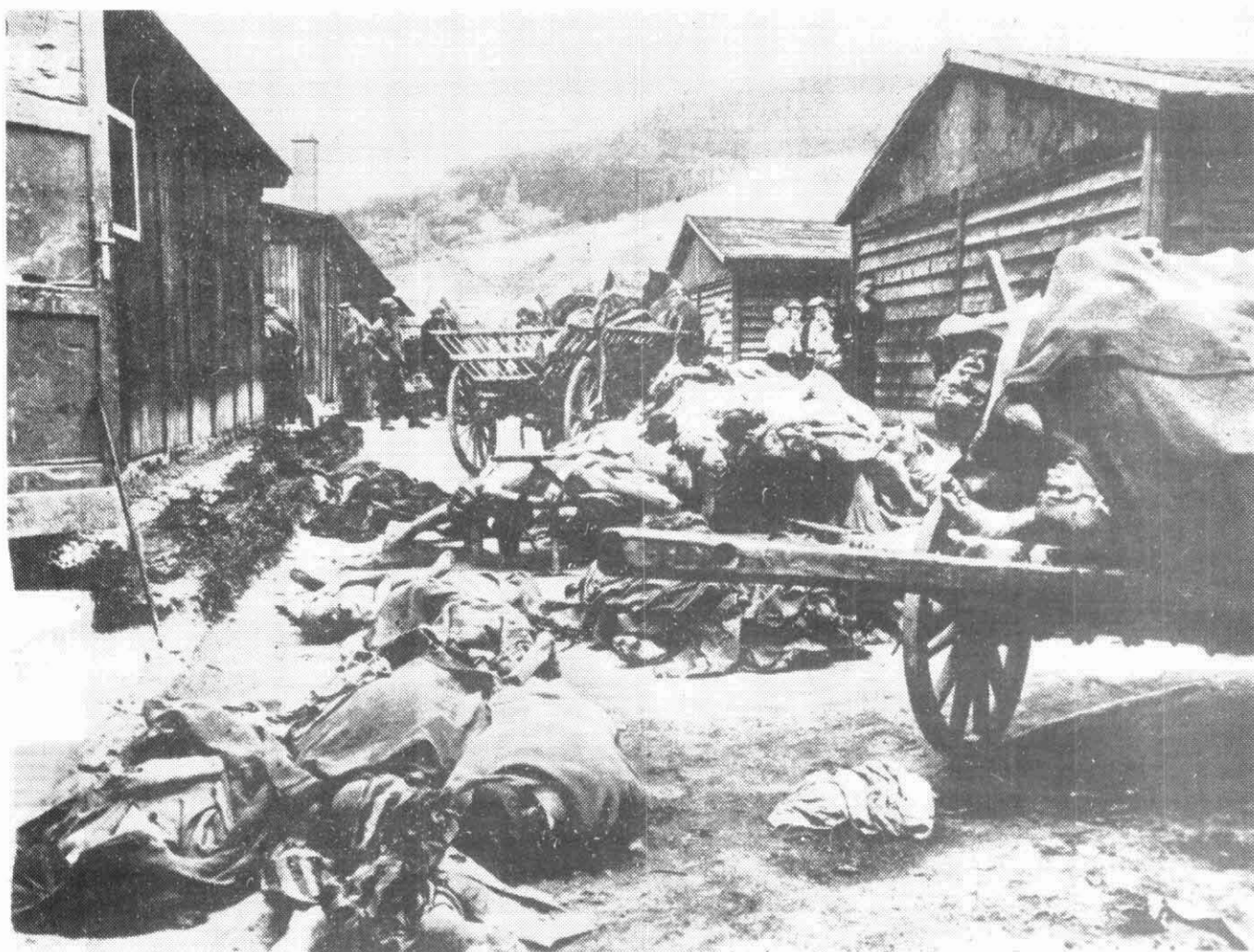
Entrada dels americans a Gusen el 5 de maig de 1945

L'endemà, ens entaforaren en un tren. Cada cop que trèiem el cap per la finestreta ens apuntava una metrallera.