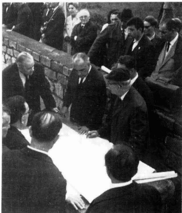
Plànol del futur monument de Gusen amb el comitè internacional (9-5-1964)

El cap havia de tenir molt mal cor perquè la feina que tenia era de castigar els altres presoners i els pegava. Era un tipus de persona sense cap sentiment. La majoria eren