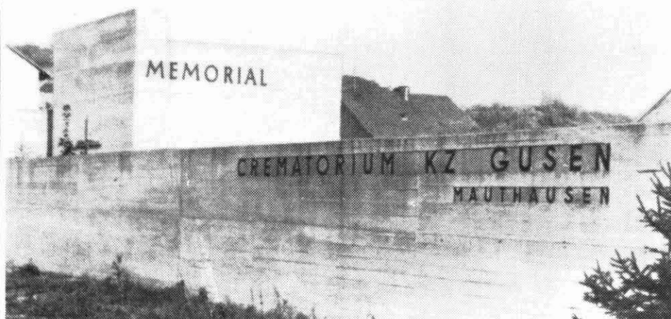
Memorial de Gusen