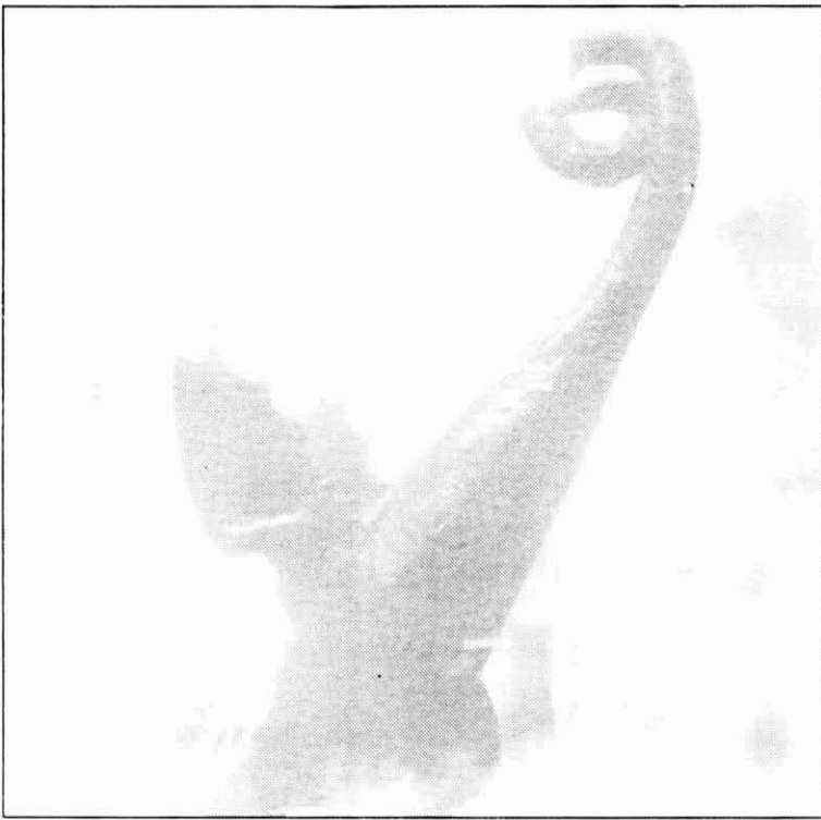
Actuació del Drac de Vilafranca del Penedès

drac i els diables, manifestacions ambdues que han arribat fins els nostres dies.