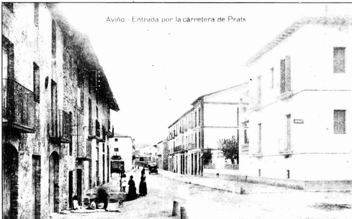
Avinyó - Entrada per la carretera de Prats