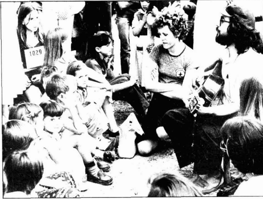
La música de participació infantil s'ha convertit en els últims anys en una nova forma d'expressió músico-popular. (Foto: Josep Brunet).