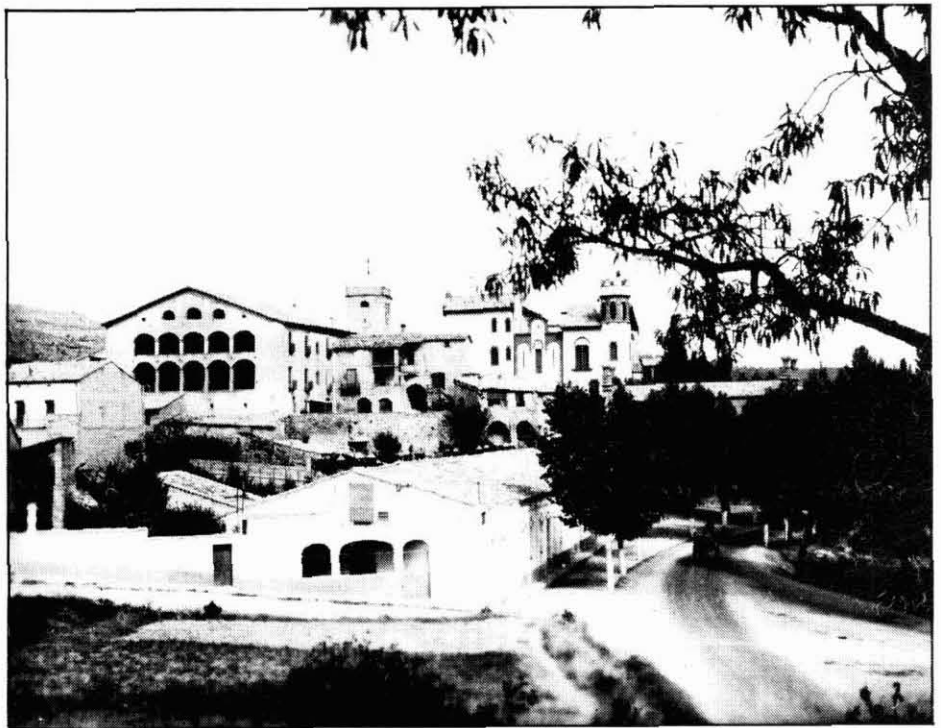
Entrada d'Avinyó.

Avinyó és un dels pobles de la comarca del Bages que, darrerament, ha estat objecte d'una exploració gairebé sistemàtica des del punt de mira de la recerca i estudi de la música tradicional. Ha estat onze el nombre de missions etnomusicològiques efectuades fins ara al llarg de quatre anys, a part de les estades més o menys llargues. A través dels informants enquestats s'han obtingut cent vuitanta-sis informacions musicals de tota mena que, després de fer-ne una tria necessària, ha quedat reduïda a cent quinze. Tot i que per a la investigació etnomusicològica, d'entrada, no es pot rebutjar cap informació rebuda (musical o no) degut a que, com a ciència interdisciplinària, aquella pot tenir un interès extramusical de tipus etnogràfic o socio-musicològic. De fet, però, quant a la música tradicional, objecte principal de l'Etnomusicologia, cal fer una tria amb criteris que ens permetin escatir els elements d'una cultura verament tradicional (vinculada a la transmissió oral i, per tant, a l'aspecte anònim de les informacions) d'aquells elements sobrevinuts d'una cultura convencional establerta (1).