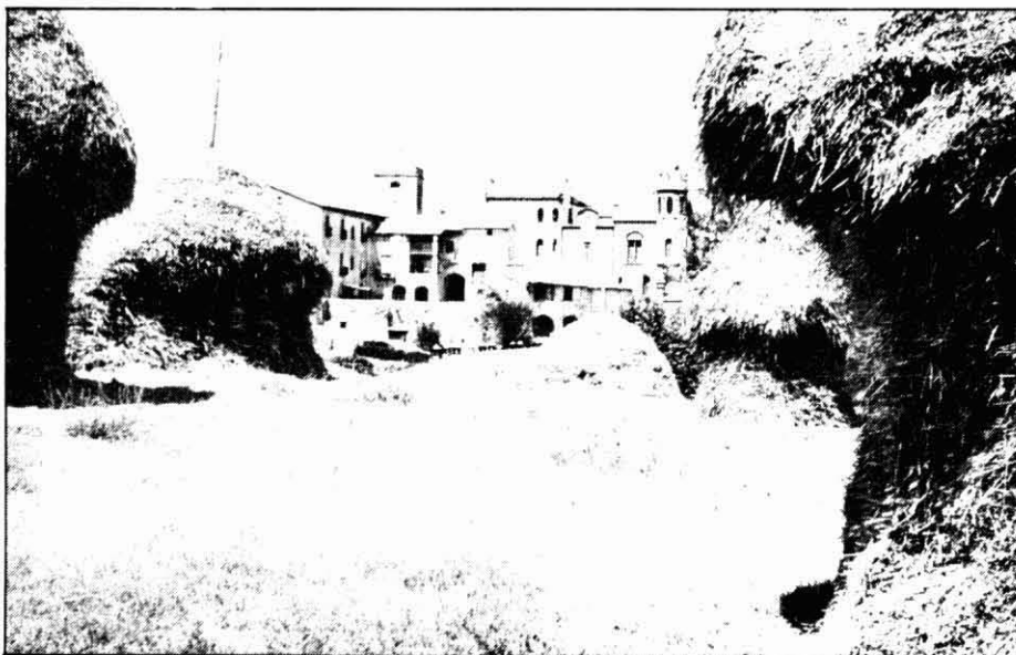
Pallers tradicionals als afores d'Avinyó. (Foto Arxiu Illa).