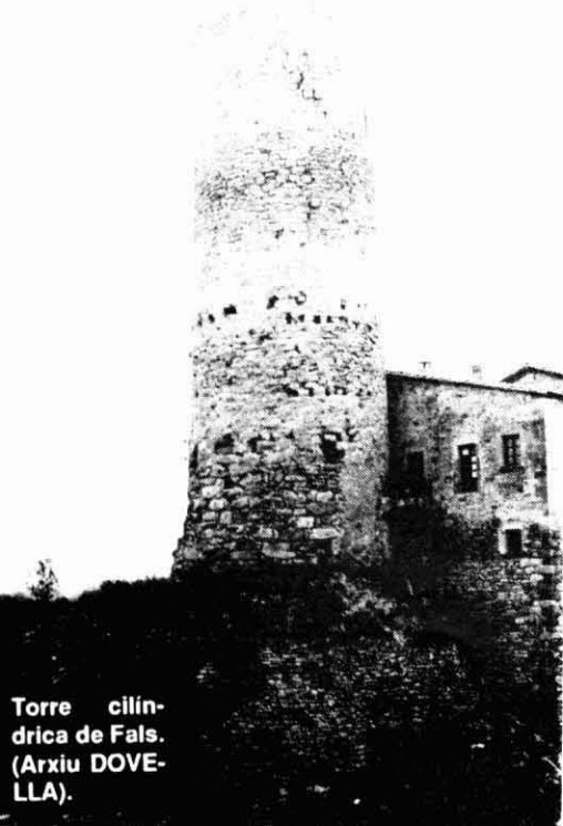
Torre cilíndrica de Fals.