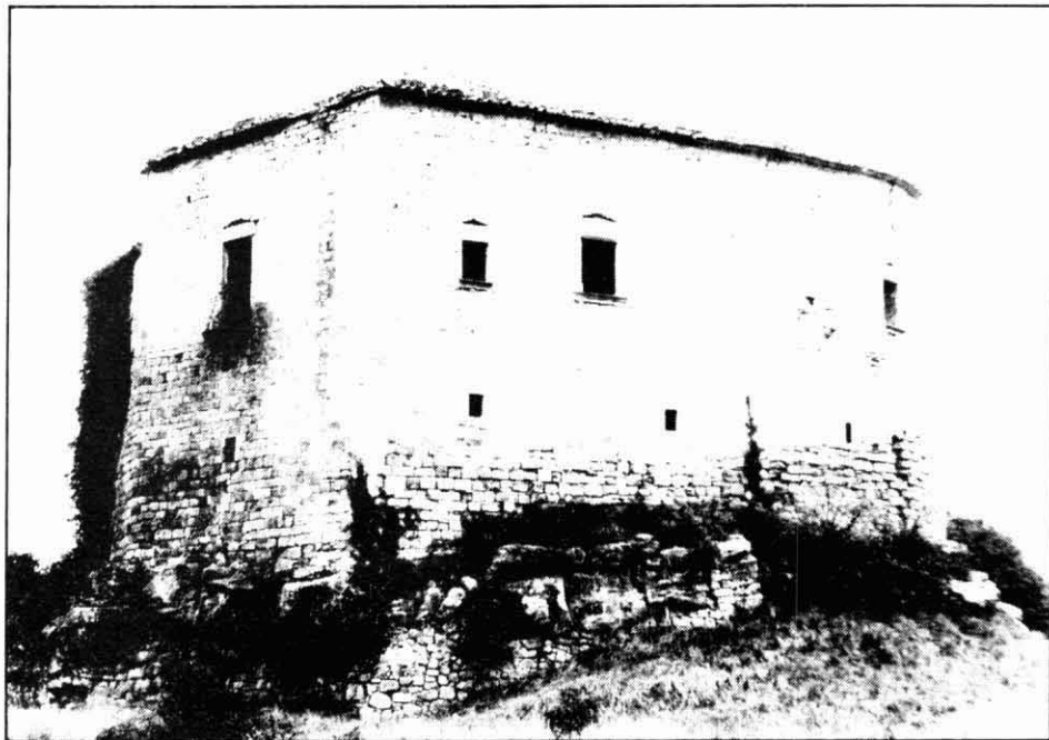
Castell de Castellar (Aguilar de Boixaders).

En alguns llocs una mateixa guàrdia podia servir dos castells, com la que hi havia al terme d'Artés, no gaire lluny del Llobregat, que donava senyals a aquest castell i al de Sallent; la Guardiola propera a Sant Mateu, que també podia donar avís al castell de Callús; la de Sant Fruitós, al servei d'aquest poble i del de Navarcles, cap dels quals no tenia castell.