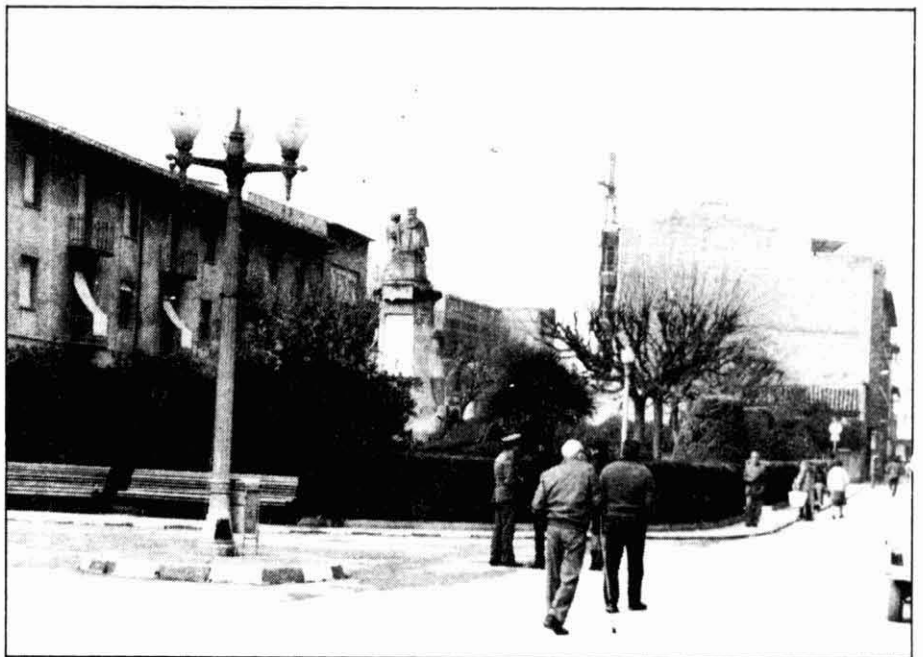
Plaça de Sant Antoni Ma. Claret.

una plaça militar, ja que el governador els havia obligat a jurar quan ho havia fet la tropa i les autoritats locals. Això passa a Vic i a la Seu d'Urgell; no sabem si aquest també era el cas de Solsona. Altres Comissions no tingueren problemes amb els militars, però alguna en tingué d'altra mena. El 21 de novembre la Comissió Corregimental amb seu a Olesa de Montserrat, comunica la relació de pobles del corregiment que tenen la Constitució i que l'han publicat, així com els que no la tenen. Al mateix temps lamenten que la Comissió no l'ha pogut publicar per les contínues alarmes i fugides. El 25 de novembre la Comissió de Talarn lamenta que no ha pogut jurar la Constitució pel fet que dos dels vocals es troben impossibilitats, un per malaltia i l'altre per convalescència. La Comissió Corregimental de Mataró, amb seu a Arenys de Mar, després d'afirmar que guardaria i compliria la Constitució degué rebre un ofici