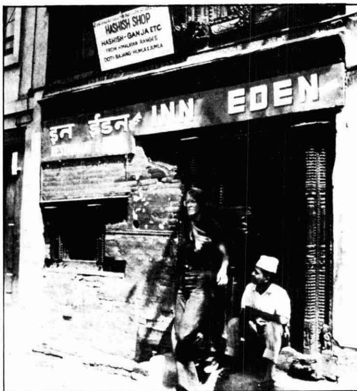
La mariuhana es ven lliurement al Nepal, però també origina problemes físics i psíquics.

La droga és un mal social, però cal pensar que també hi ha una problemàtica particular molt difícil per al drogaaddicte.