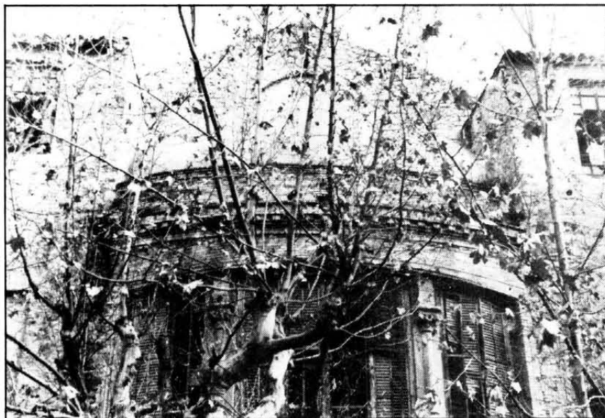
Aspecte de la cúpula inacabada.

rrera o façana de Llevant que dona amb el jardí posterior del Casino al carrer de Carrió.