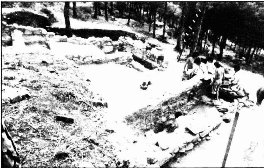
Excavacions al poblat ibèric de Burriac (Cabrera de Mar, Maresme). Campanya de 1984

Segons l'Estatut d'Autonomia la Generalitat té competències exclusives sobre Patrimoni Històric, Artístic, Monumental, Arquitectònic, Arqueològic i Científic