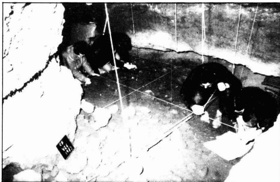
Excavacions a la Cova del Frare de St. Llorenç del Munt (Matadepera, Vallès Occidental). Campanya de 1983

Segons aquesta Llei integren el Patrimoni Històric Espanyol els immobles i objectes mobles d'interès artístic, històric, paleontològic, arqueològic, etnogràfic, científic o tècnic. També forma part d'aquest el patrimoni documental i bibliogràfic, els jaciments i zones arqueològiques, així com els llocs naturals, jardins i parcs, que tin-