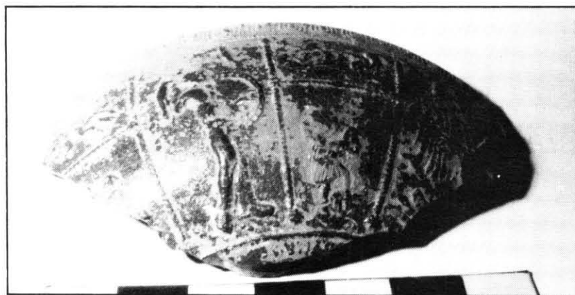
Peça sigil·lata (4086) sud·gàl·lica, procedent del Puig Cardener (forma Drag. 37-A).