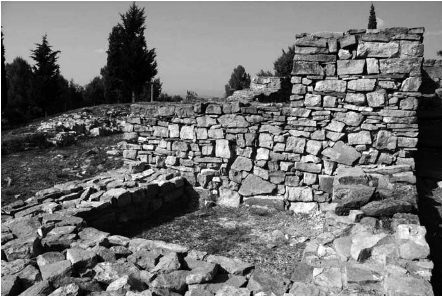
El Cogulló (Sallent, Bages).