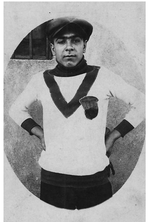
Porter de fútbol del Flor de Lis a la barriada del Poble Nou el 1928.

La restauració borbònica de 1874 i les guerres de Cuba i Filipines creen un estat de misèria, amb un ressorgiment flagrant del caciquisme, que és el conreu d’unes accions que enfronten els de baix amb el reaccionarisme de la patronal cosa que comporta un estat de revolució latent.