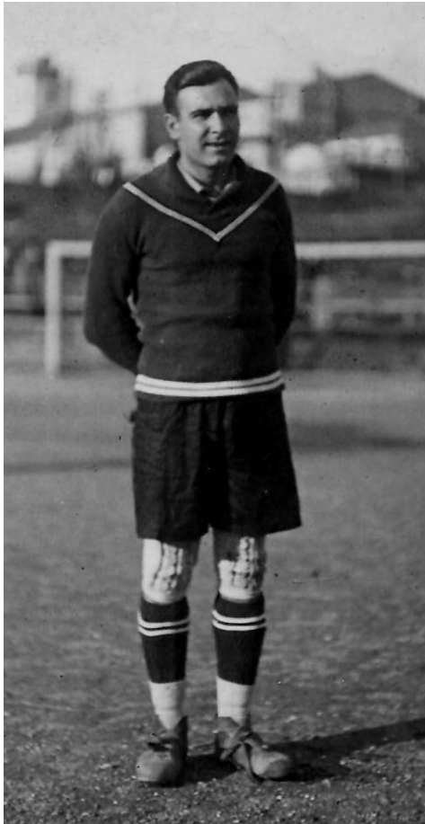
Porter del C.E. Manresa el 1935.