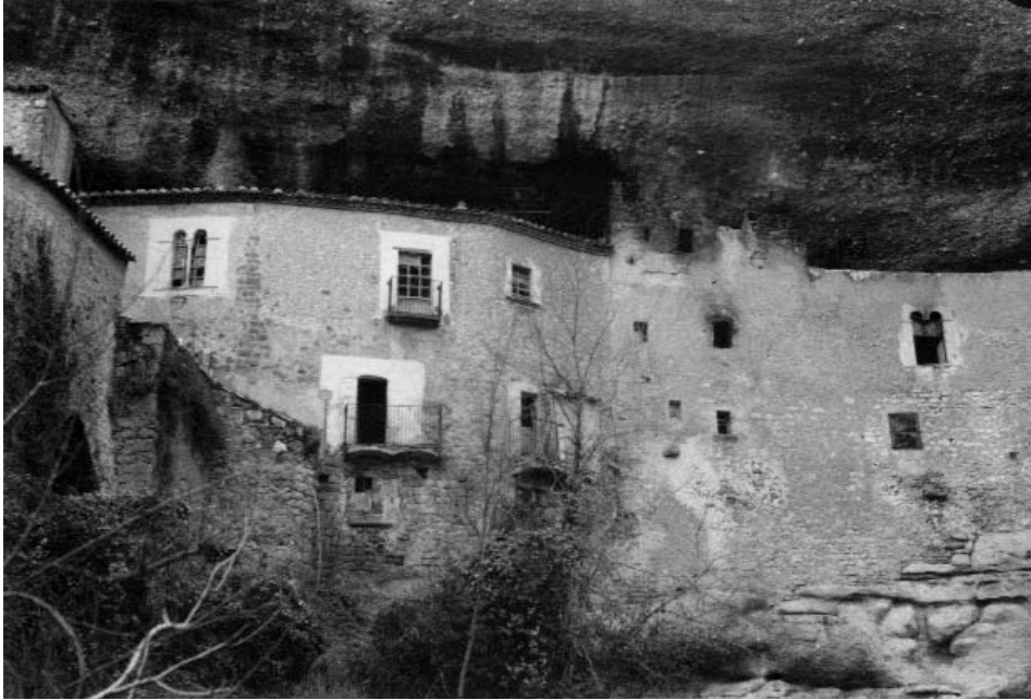
El mas Puig de la Balma (Mura), l'any 1974