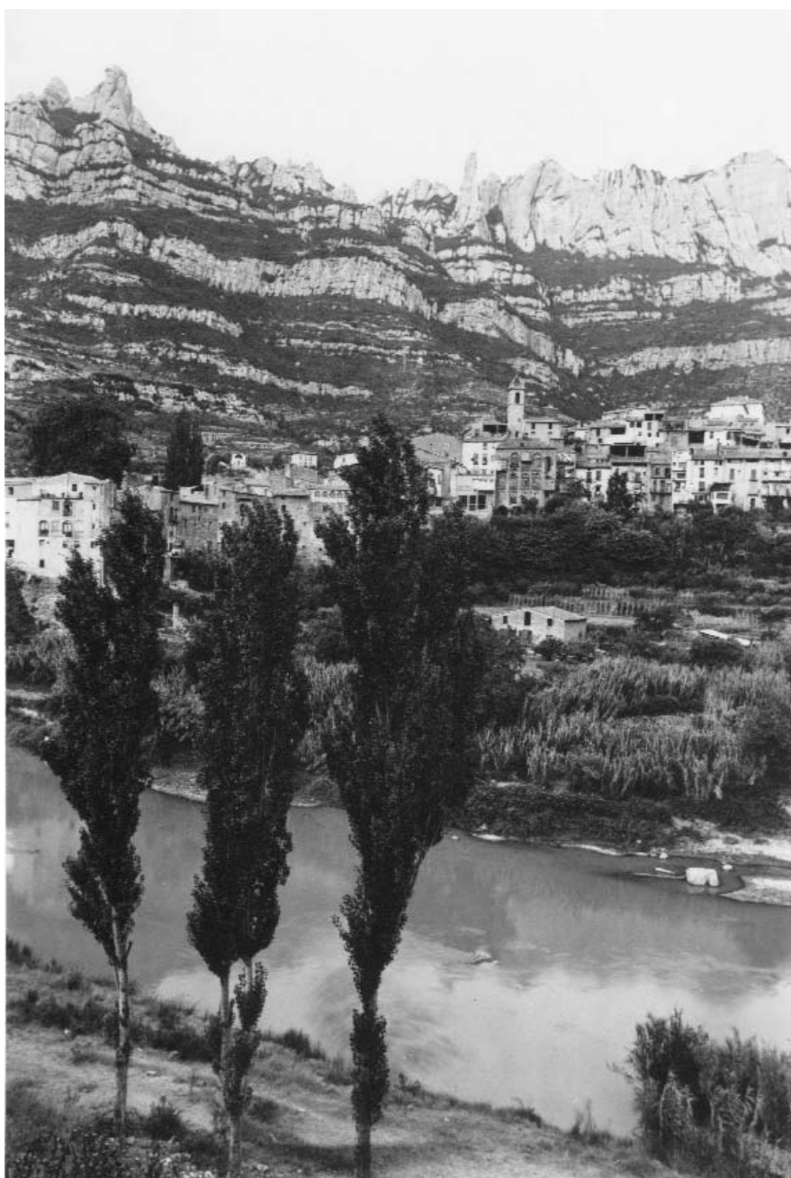
Monistrol de Montserrat als anys 70 del segle XX