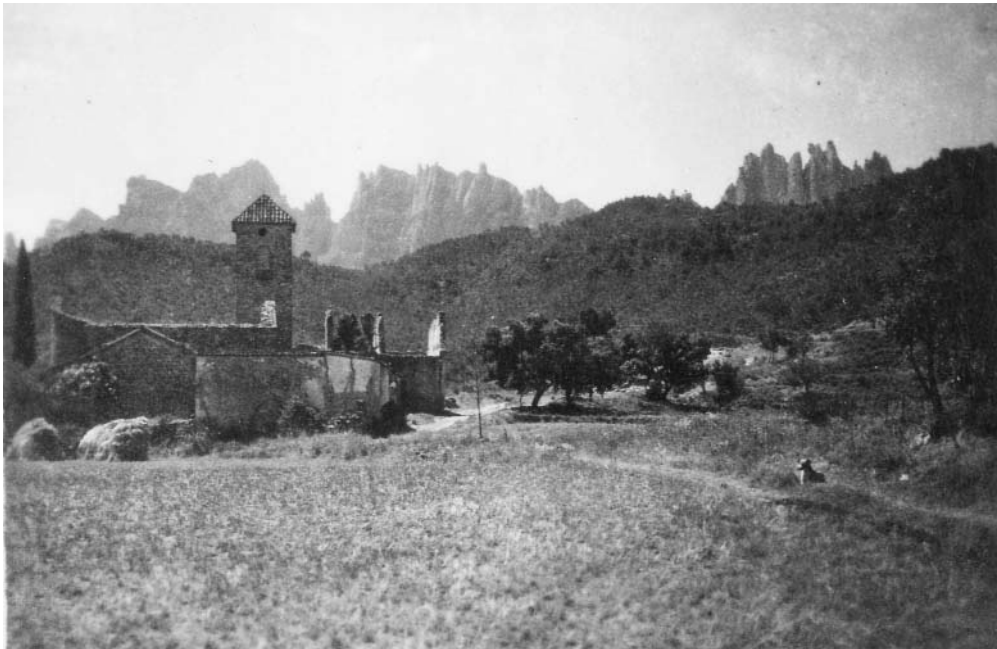
L'església de Marganell a la primera meitat del segle XX

contra Castellbell i el Vilar, “pero los catalanes les embistieron con tanto denuedo, que le fue preciso replegarse a su primera posición”. 18