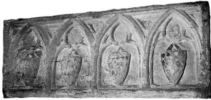
5. Sarcòfag del Museu Comarcal de Manresa.