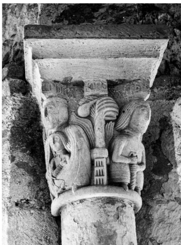
1. Capitell del claustre del monestir de Sant Benet.

Ara bé, qui podia ser aquest Bernat, costejador d'una obra important com la d'una ala del claustre? Aleshores, a principis del segle XIII, les tres famílies senyoriales més poderoses de la comarca eren els Rocafort, els Calders i els Talamanca, i aquests, més que els altres dos, per l'extensió dels seus dominis, pel nombre de focs o masos