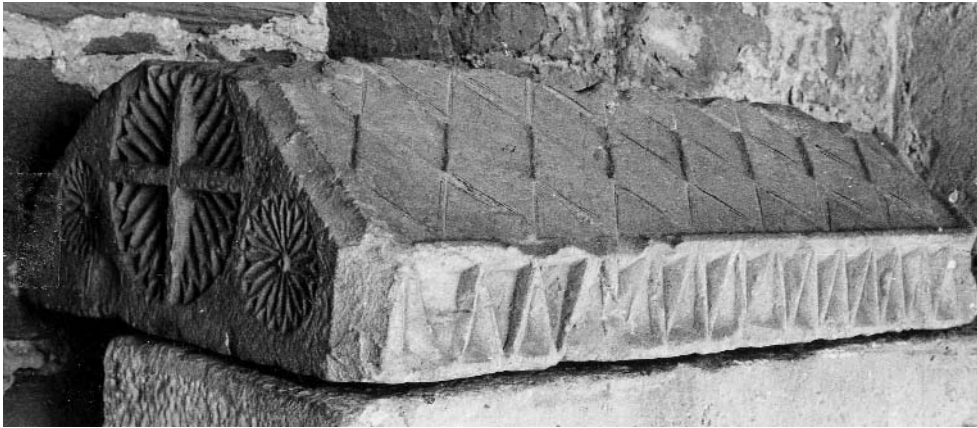
2. Tapa d'un sarcòfag de Sant Benet.