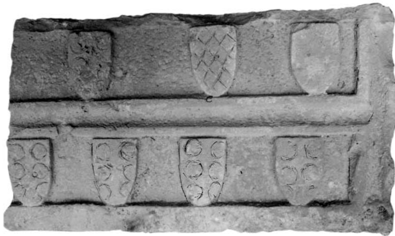
6. Fragment d'urna del monestir de Sant Benet.