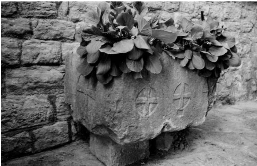
3. Sarcòfag del castell de Talamanca.