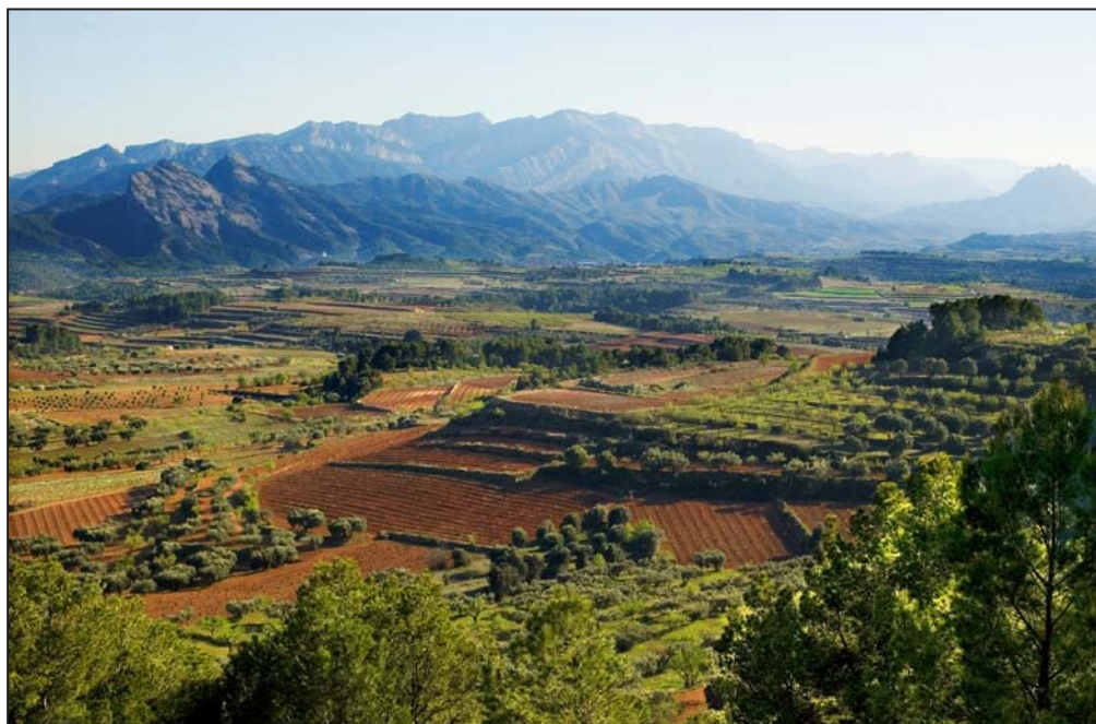
FIGURA 2. La Plana de la Terra Alta, autèntic paisatge del Mediterrani interior català