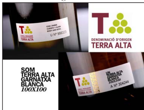
FIGURA 5. Una denominació d'origen, dos distintius de garantia

Dit això, es pot començar a entendre el concepte de l'expressió mediterrània en els vins i vins de licor acollits a la DO Terra Alta, una autenticitat que, sense cap dubte, ha estat objecte d'un refinament continuat des dels anys noranta, i ha permès el refinament d'uns vins que històricament s'havien relacionat amb un perfil dominat per sensacions rústiques i paladars valents.