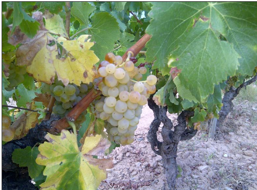
FIGURA 3. La varietat de raïm garnatxa blanca

És a través de les garnatxes on es fa més evident un dels trets diferenciadors de la zona: el predomini de les varietats tradicionals. Destaca, aquí, un testimoni històric datat el 1647 que deixa constància d'una plantació de vernaxa , possiblement blanca, per part de mossèn Onofre Català, al terme municipal de Gandesa. La garnatxa blanca, la garnatxa negra i la garnatxa peluda són les varietats de raïm predominants i de major edat. De fet, la zona és la regió vitivinícola mundial amb major concentració de la varietat garnatxa blanca. Aquestes,