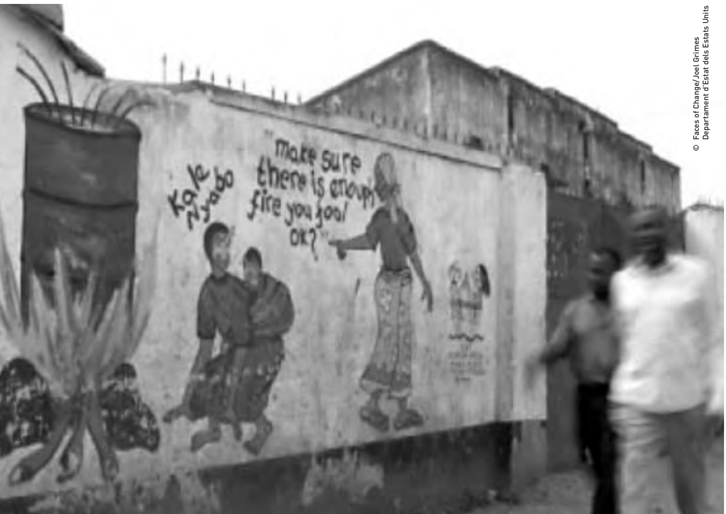
© Faces of Change/Joel Grimes Departament d'Estat dels Estats Units

Diversos factors, entre els quals podem citar una pobresa cada cop més gran, unes condicions de vida cada cop pitjors, una manca persistent de llocs de treball, conflictes, tota mena de privacions i penúries, i el sentiment d'un futur ombrívol a la regió han afavorit l'aparició d'unes condicions ambientals en les quals ha pogut florir el tràfic d'éssers humans.