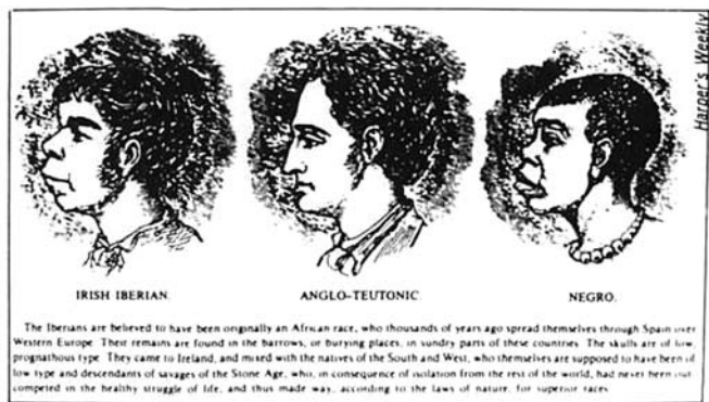
Il·lustració de la revista Harper's Weekly