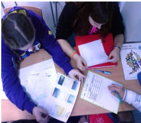
Figura 4. El dia d'entrega, cada grup equip de treball avalua els tríptics dels altres equips i anota sobre una rúbrica en blanc en quin nivell es troba el tríptic per a cada ítem d'avaluació, i quina nota global li correspondria, a més de propostes de millora.