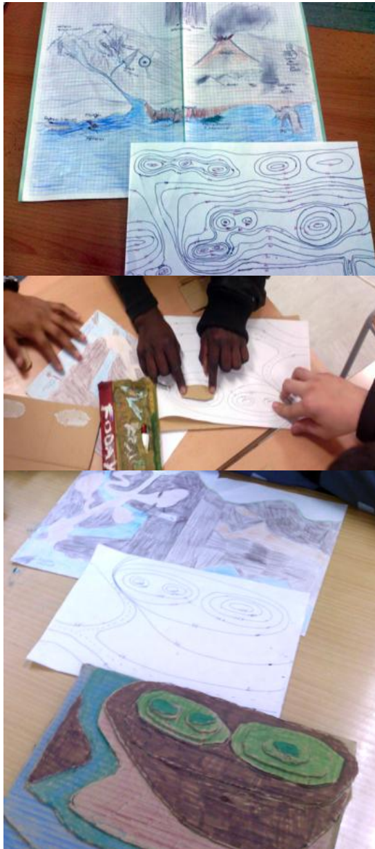
Figura 2.- Deduir les corbes de nivell a partir d'un paisatge inventat promou la percepció del relleu com a resultat de la interacció de diversos agents geològics, i inicia el paper d'experts dels experts topògrafs i geòlegs. Alguns alumnes amb dificultats d'aprenentatge han ampliat aquesta activitat, fent una maqueta en 3D del paisatge original a partir del mapa de corbes de nivell.

plia i integradora de les formacions geològiques en el seu conjunt i fer-los interioritzar la idea que el paisatge és el resultat de la interacció de diferents agents geològics.