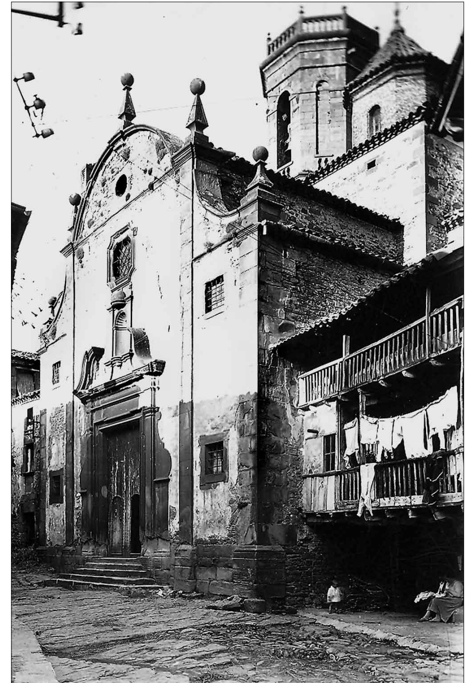
Església de Sant Miquel de Rupit a principis del segle XX.