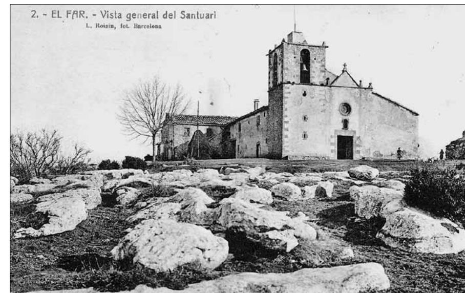
Santuari del Far a principis del segle XX.

de 1730 s'havia «lloablement fet una casa cerca dita capella a fi de tenir hostal en aquella», al costat de la casa de l'ermità, cosa que no agradà al bisbe. El 1773-1775 es feia el campanar a Cabrera, el 1783 s'ampliava l'hostatgeria on residia un ermità; el 1789 es contractava el retaule major a Josep Pujol i s'inaugurava en un aplec el 8 de setembre de 1792; el 1794 es va pintar tot l'interior, i finalment el 1798 es va col·locar la gran reixa al presbiteri. 44 El Far pateix molts canvis: es refà la teulada entre 1710 i 1725 —i novament el 1783—, el campanar s'alça el 1720 —destruït per un llamp el 1754—, la façana es construeix el 1726 —amb la inscripció esborrada a la llinda de la porta que diu STELLA MARIS—, el 1735 es va rebatre l'interior de l'església i el 1757 es va construir la sagristia nova. 45