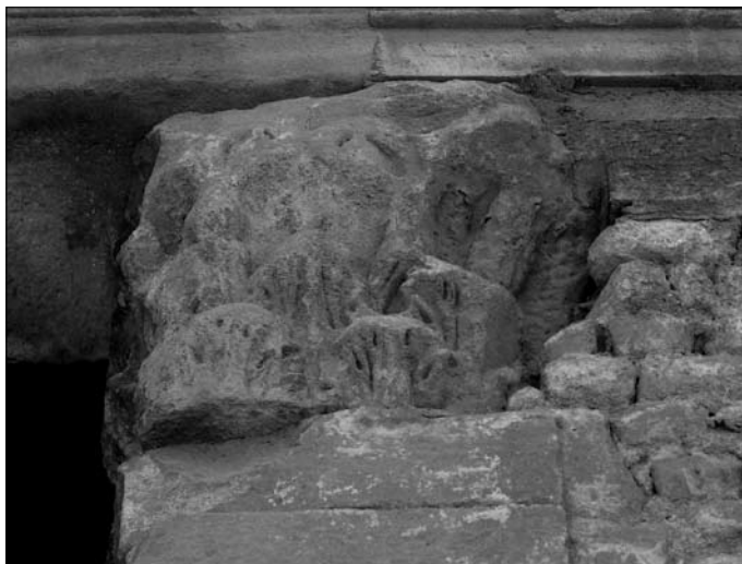
Fig. 4 i 5.