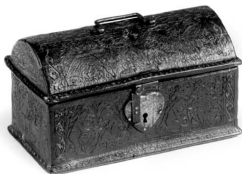
Arqueta de cordovà. Catalunya, s. XIV.