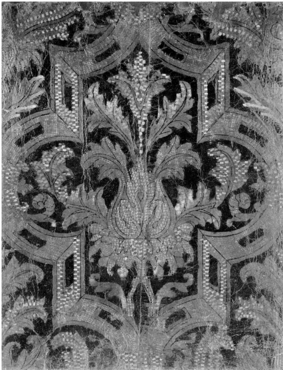
Revestimant de paret de guadamassil. Espanya, finals s. XVI o principis del XVII.