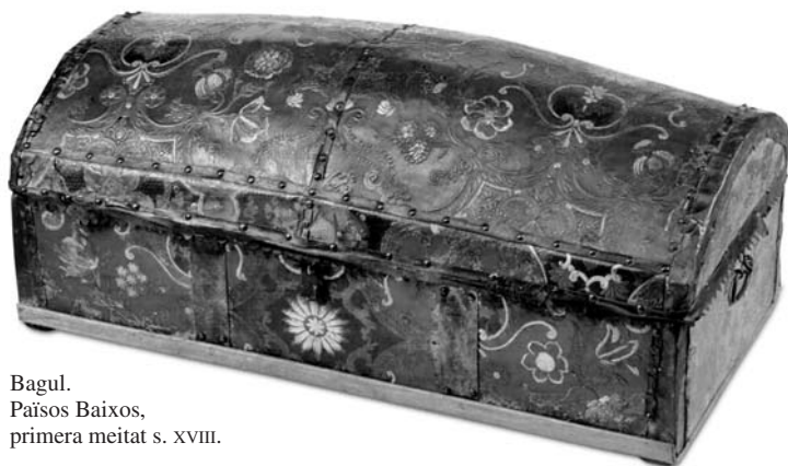
Bagul. Països Baixos, primera meitat s. XVIII.