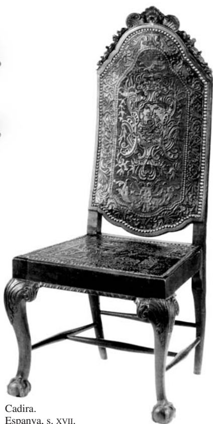
Cadira. Espanya, s. XVII.