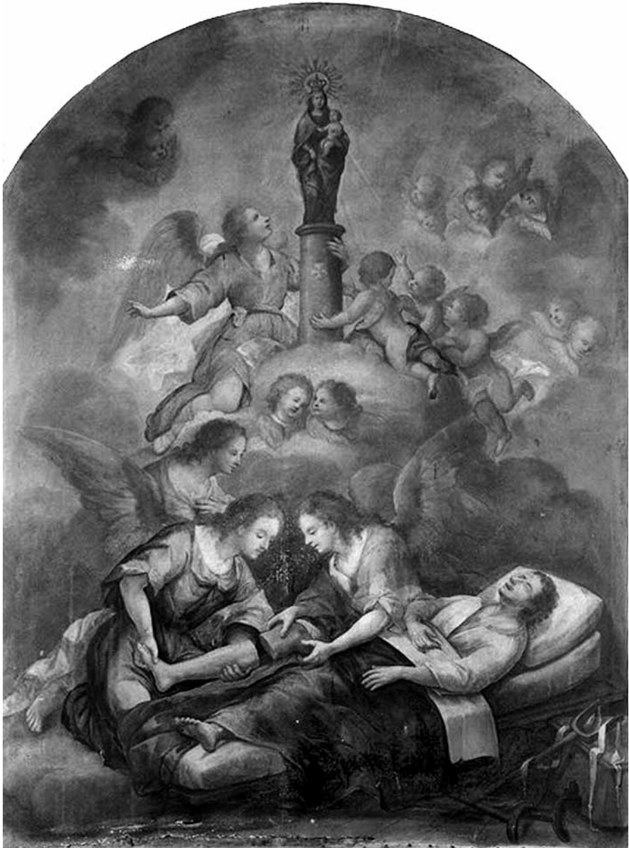
Curació . Quadre pintat per Marià Colomer i Parés vers 1802 per a la capella del Pilar de la catedral de Vic, on es conserva.

(Núm. Inventari BdV 28901.).