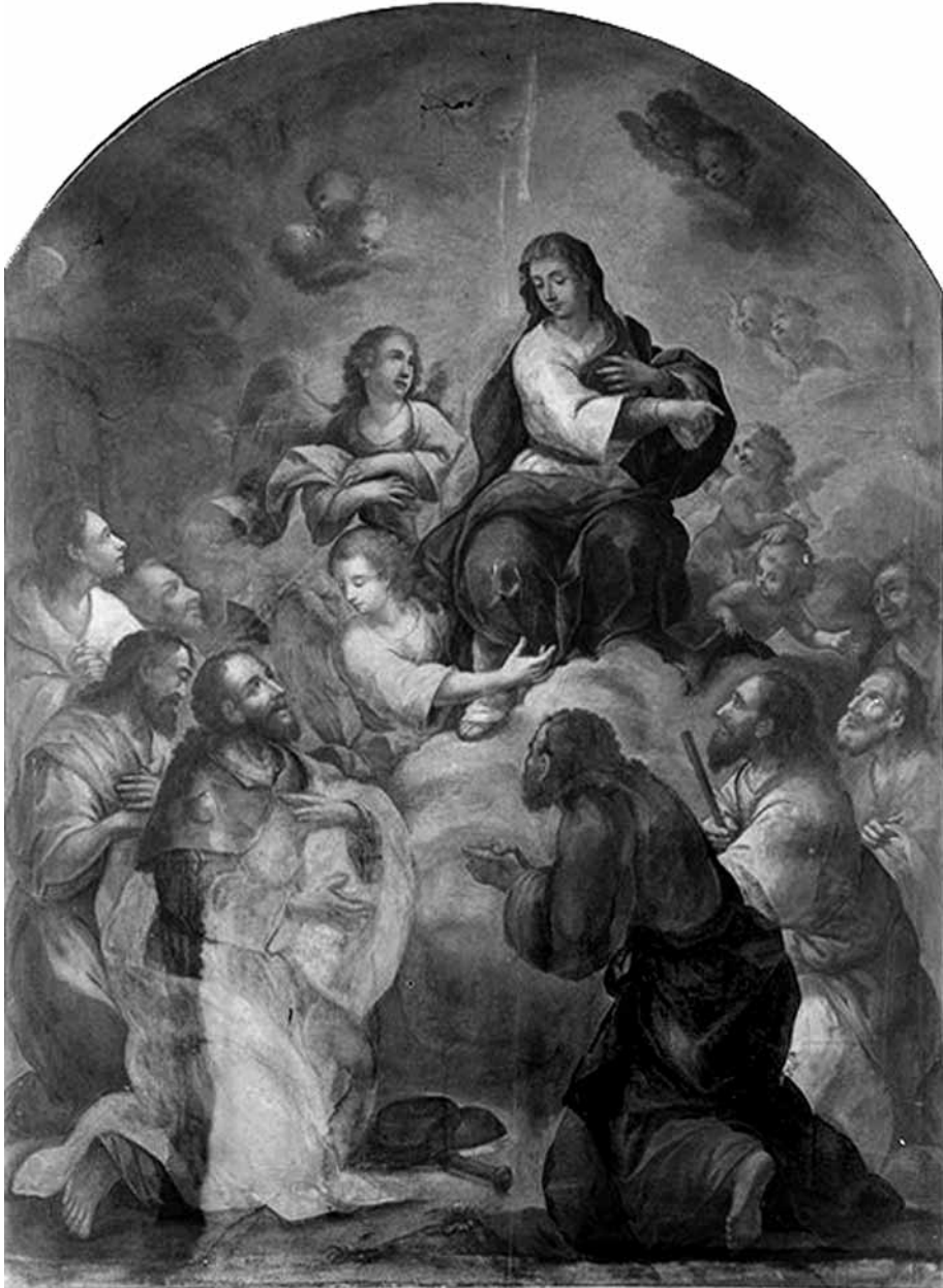
Aparició de la Verge del Pilar a l'apòstol sant Jaume, a Saragossa. Quadre pintat per Marià Colomer i Parés vers 1802 per a la capella del Pilar de la catedral de Vic, on es conserva.

(Núm. Inventari BdV 28902. Arxiu Fotogràfic del Bisbat de Vic).