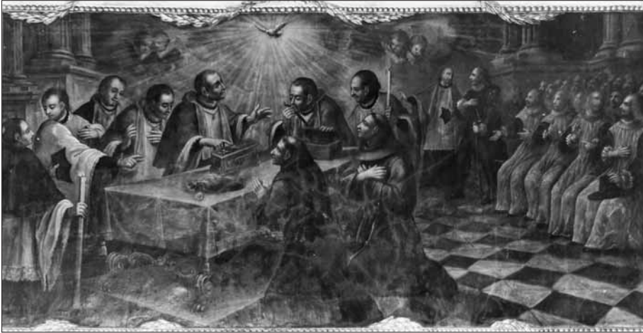
Miracle de l'augment de les cendres dels sants Llucià i Marcià. Llenç pintat per Marià Colomer i Parés vers 1791 per a la capella dels Sants Màrtirs de l'església de la Pietat de Vic, on es conserva.