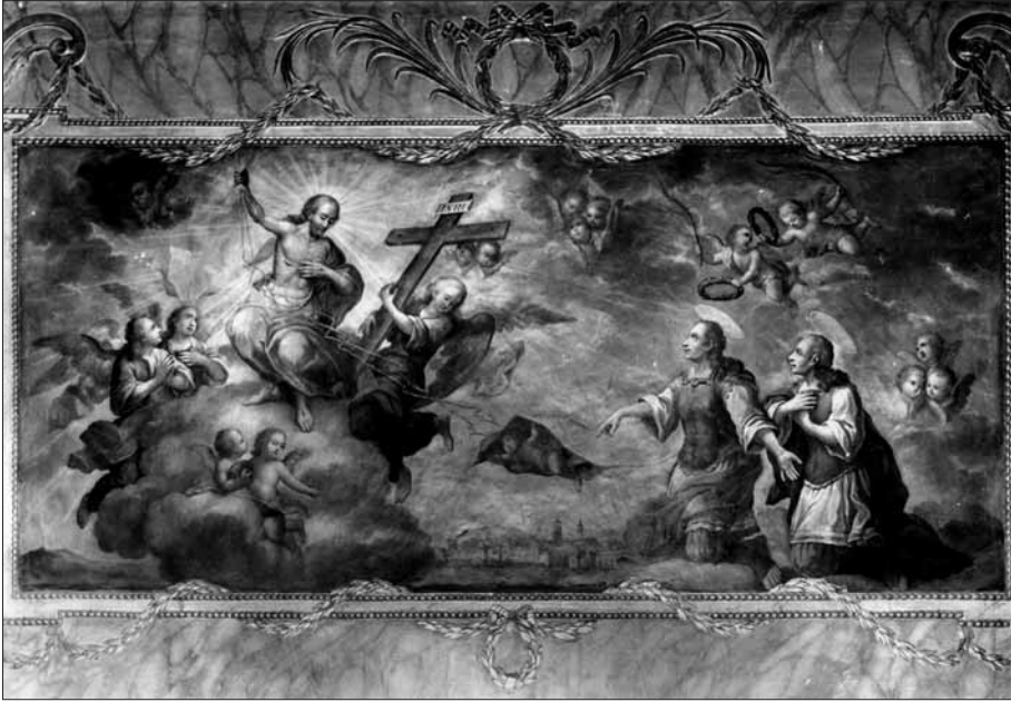
Patrocini dels sants Lluçia i Marcia sobre la ciutat de Vic. Llenç pintat per marià Colomer i Parés vers 1791 per a la capella dels Sants Màrtirs de l'església de la Pietat de Vic, on es conserva.