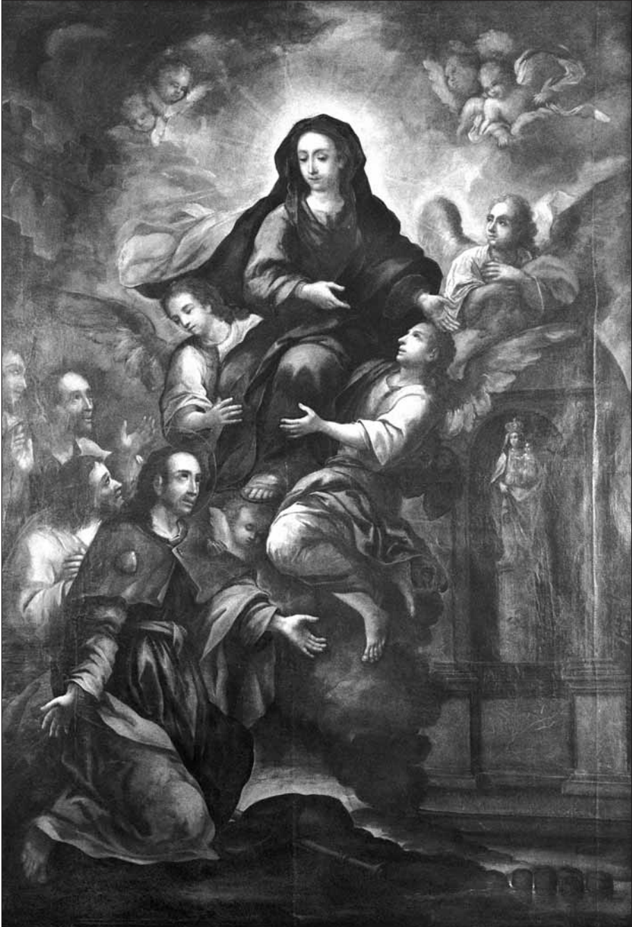
Aparició de la Verge del Pilar a l'apòstol sant Jaume, a Saragossa. Quadre pintat per Marià Colomer i Parés vers 1800 per al saló de sínodes del palau episcopal de Vic, on es conserva. (Núm. Inventari BdV 802.).