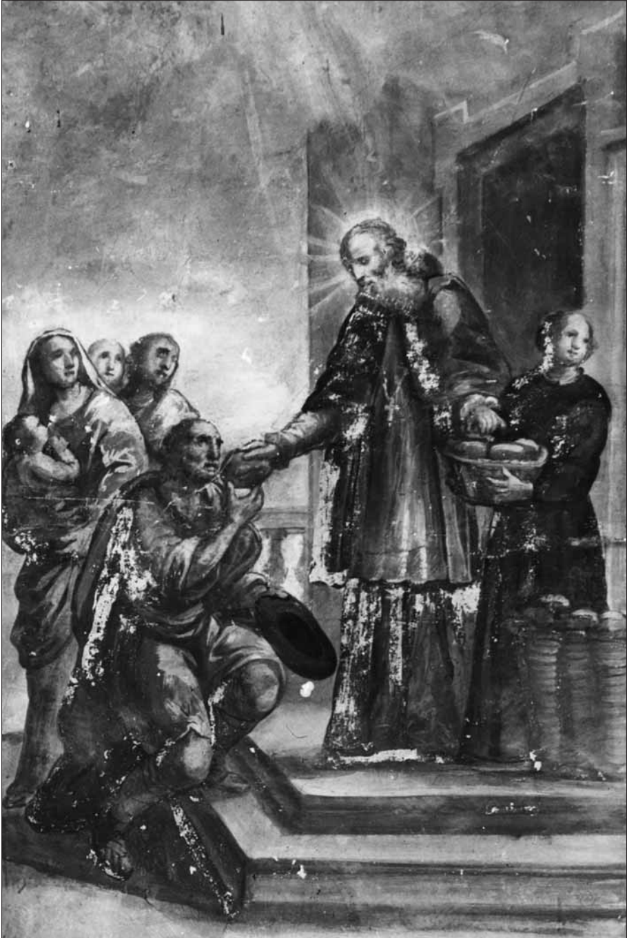
Sant Llibori repartint pa als pobres. Pintat al fresc per Marià Colomer i Parés vers 1788 per a l'altar de Sant Llibori de l'església de la Pietat de Vic, on es conservà fins al 1936. (Fotografia de l'Arxiu Mas, de Barcelona).