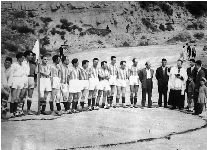
Inauguració del camp de futbol (2 d'abril de 1961).

La carretera dividia en dues parts l'esmentat sòl. En la superior es faria un camp de futbol i en la inferior un poliesportiu amb dues piscines, una gran i una petita, i un camp de bàsquet.