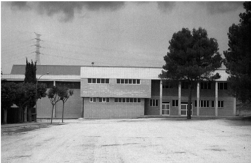
Centre Social. Any 2007.