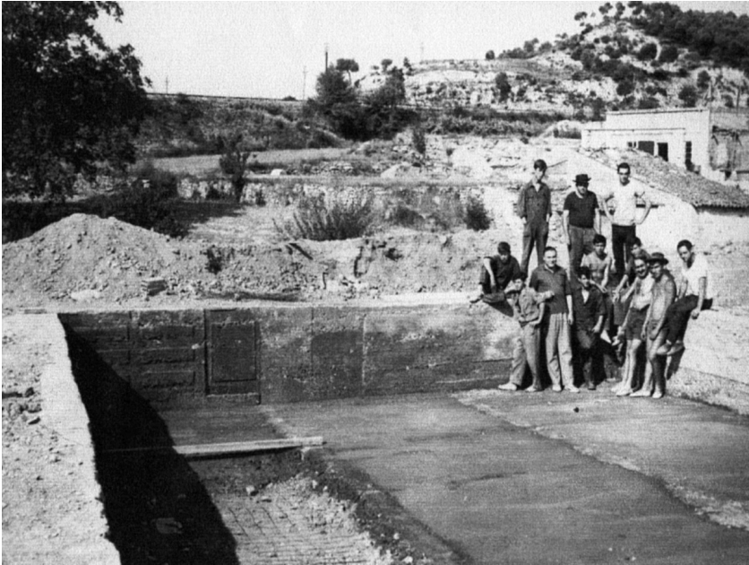
Construcció piscina petita. Any 1965.

El proper pas per a la construcció de la piscina gran fou la donació dels terrenys propietat dels Amics de Vimbodí a l'Ajuntament de Vimbodí, ja que així es podria aconseguir una important subvenció per a la seva consecució. Per la importància d'aquesta donació, transcrivim el certificat que l'entitat va trametre, amb data de 15 de novembre de 1974, a l'Ajuntament de la vila: