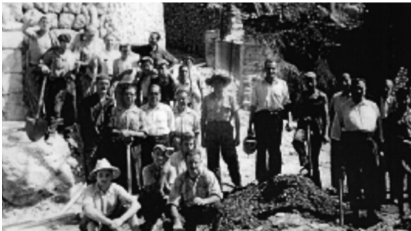
Realització dels treballs a les Fonts.