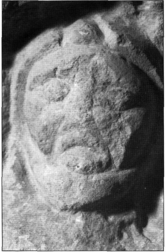
Fig. 7. Detall de la cara de l'estela funerària

D'aquesta manera, podem suposar que la peça es pot identificar amb una estela funerària datable en època romànica o amb regust d'aquest estil. Sobta, però, una decoració antropomorfa d'aquesta cronologia, segles XII-XIII o un xic posterior, en un monestir cistercenc. Ens hem de plantejar, però, que pot procedir d'un altre lloc, com succeix amb algunes peces conservades en o del monestir, arribades o desplaçades durant l'exclaustració. D'altra banda, es pot pendre com una senyalització funerària de l'enterrament d'un laic o un familiar, d'acord amb l'ús, i més quan sabem que a Poblet s'enterraven no tan sols els seus religiosos, sinó també nobles, menestrals, etc. relacionats amb el cenobi. 27