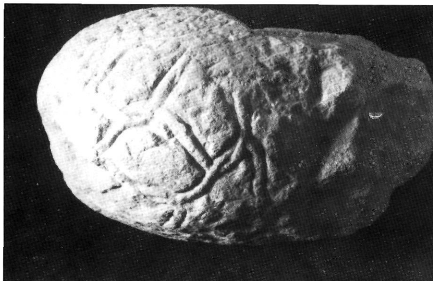
Fig. 6. Lateral de l'estela funerària on podem apreciar la decoració anterior de la peça, a la manera d'entrellaçament o treball de cistell

l'ha datat en època romana, tot i que segurament és medieval, és el de Viniegra de Abajo (la Rioja) i simbolitza la figura del difunt de forma impersonal, tot materialitzant expectatives de vida eterna o heroica 22 .