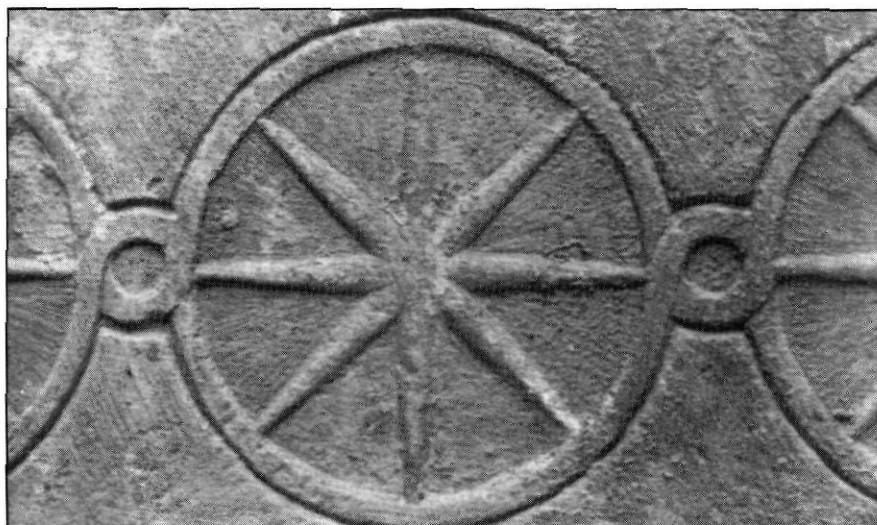
Fig. 3. Detall de la decoració del sarcòfag