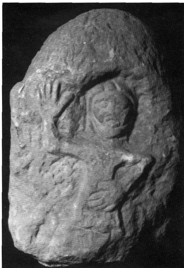
Fig. 4. Cara principal de l'estela funerària

aprofita una peça anterior. 16 Així, en aquest estil, tot i que més ben elaborat, tenen la decoració dels capitells del claustre de la catedral de Tarragona, del segle XIII 17 , i quant als acabats i la tècnica de treball del cabell i les fàcies, per exemple, el capitell 1 de la Casa de la Canonja de Girona, de final del segle XII i principi del segle XIII. 18