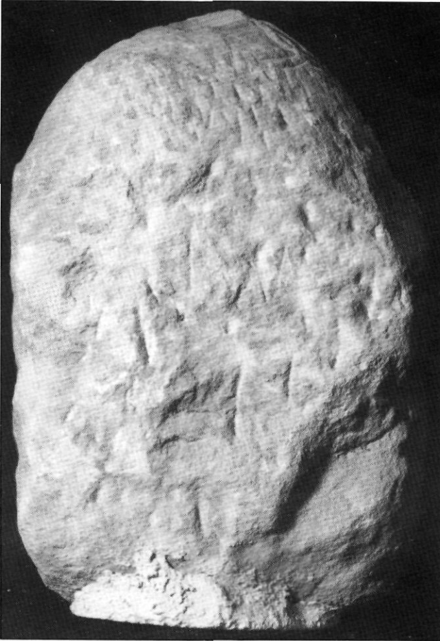
Fig. 5. Cara posterior de l'estela funerària

Quant al tema de l'orant, es documenta en l'art romànic, com els casos de Sant Quirze de Pedret 19 , la pila baptismal de Sant Jaume dels Domenys, dels segles XII-XIII, per posar un exemple proper 20 o en el bloc esculturat procedent de l'església de Sant Bartomeu de Pugis (la Noguera) 21 .