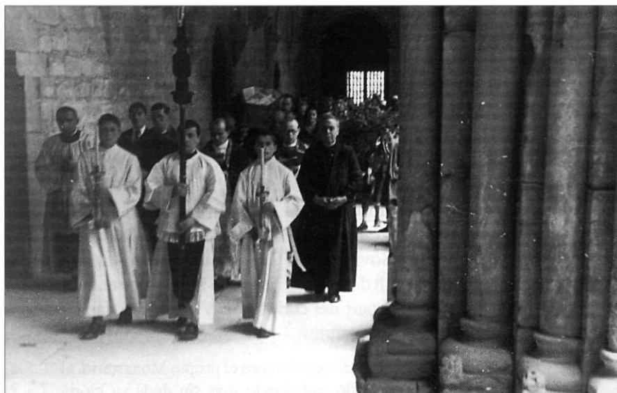
Enterrament d'Eduard Toda a Poblet. 27 d'abril del 1941.