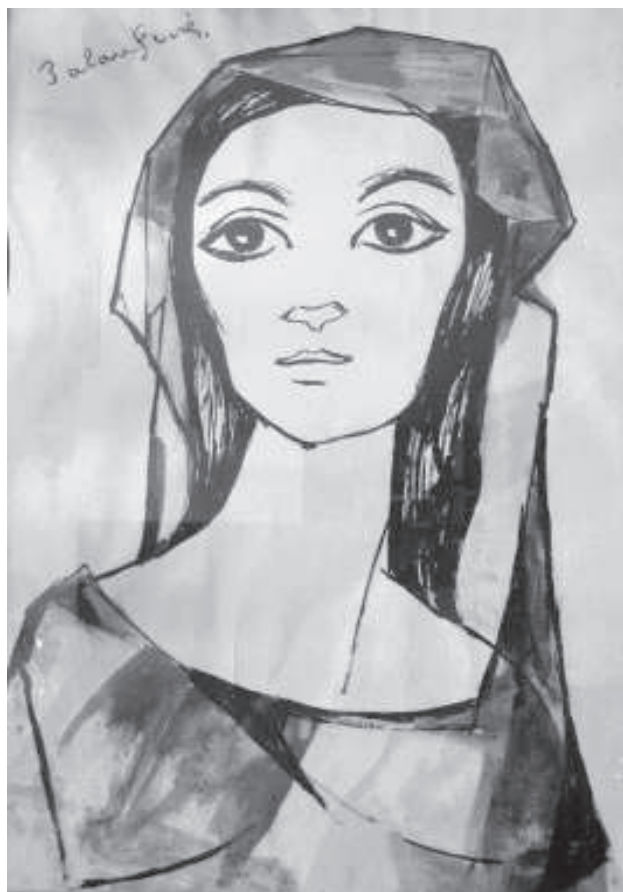
Noia amb vestit de tonalitats