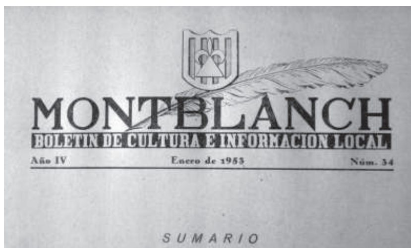
Portada de la revista Montblanch .