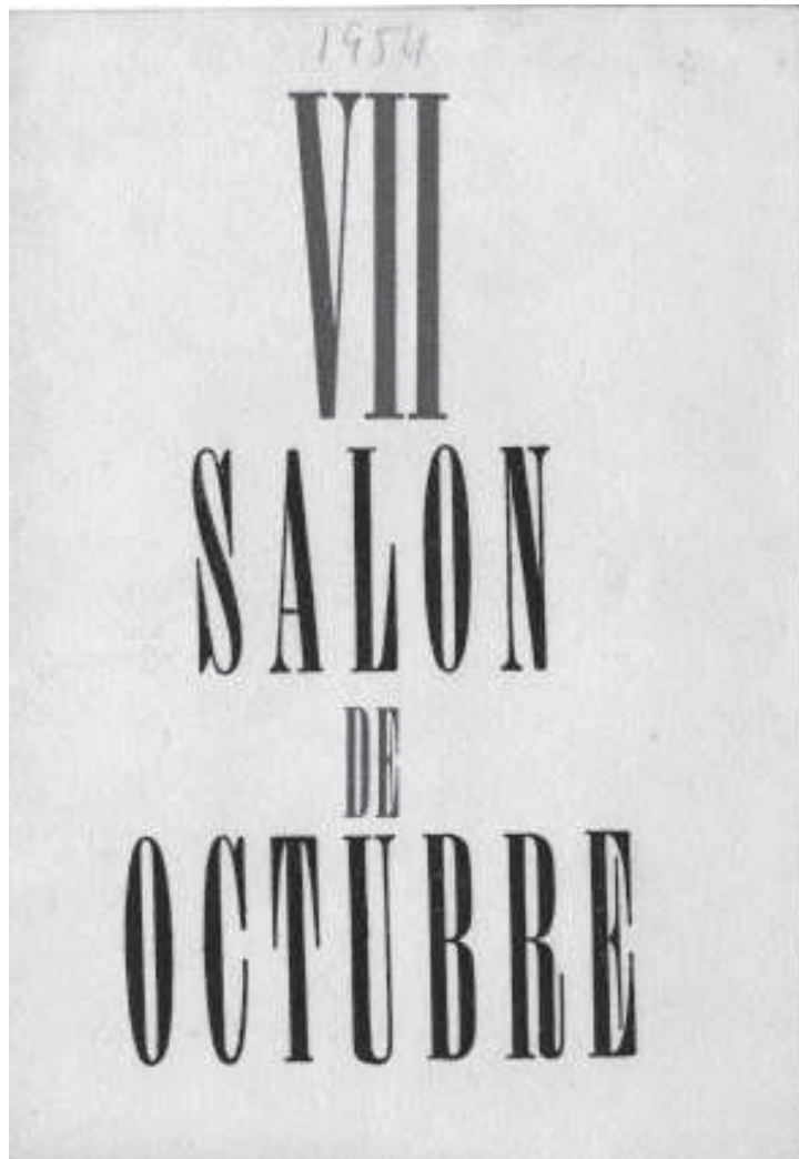
VII Sal6n de Octubre.1954.

Com en el cas precedent, per poder oferir al lector un criteri s6lid, sovint reproduïxen textualment all6 que els mitjans especialitzats detallaven. Així, a mode de titular o de frase destacaven alguna expressió o qualificatiu, però també, en ocasions, hi incorporen el conjunt de l'article, tot aportant-ne el text per a l'anàlisi.