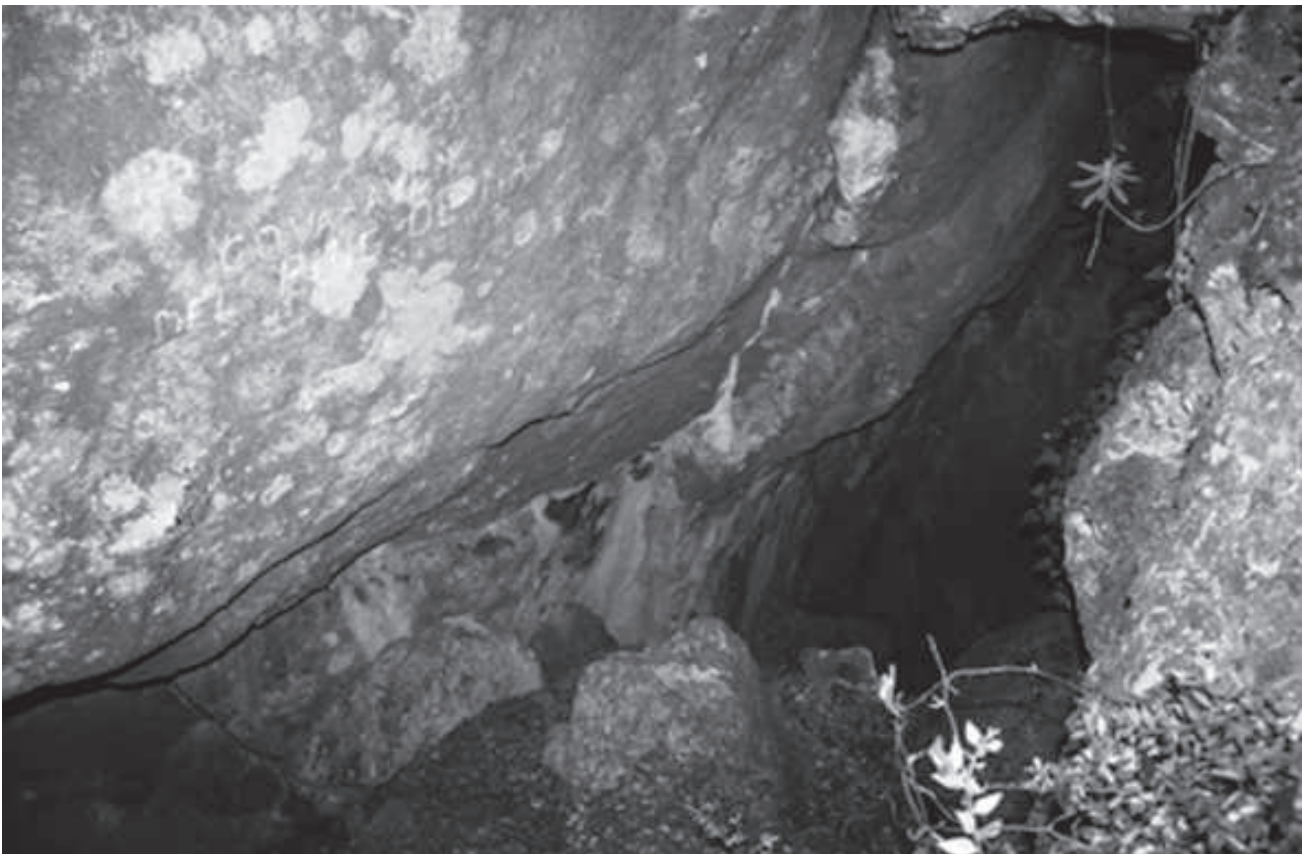
Avenc del Puig