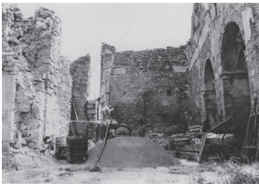
Obres de consolidació de l'església (1985)