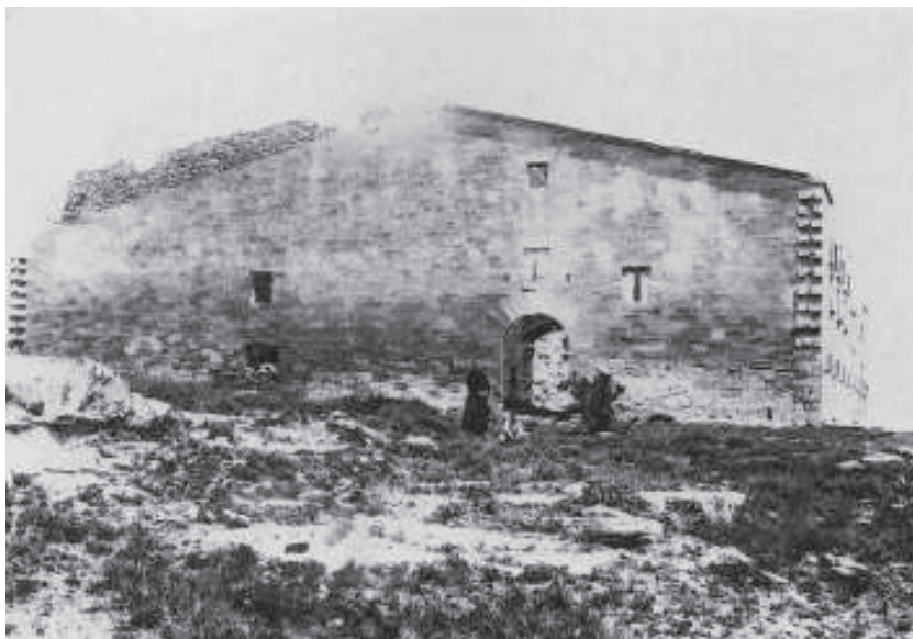
Façana occidental del santuari a començaments del segle XX