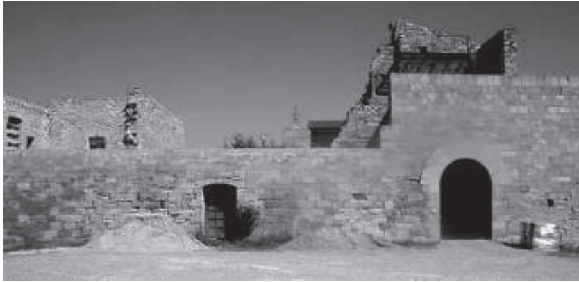
Santuari del Tallat en l'actualitat