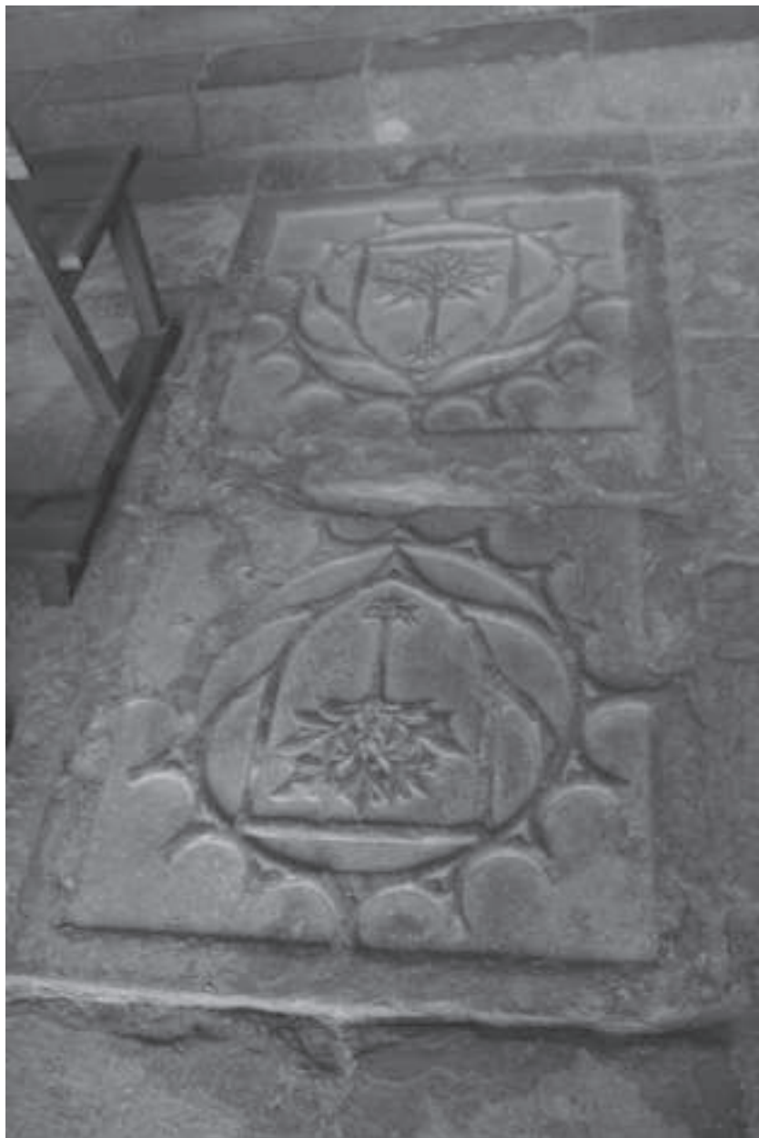
Làpida sepulcral amb l'escut dels Llorac, a l'església del Tallat (2014), (Foto Josep M. Carreras)