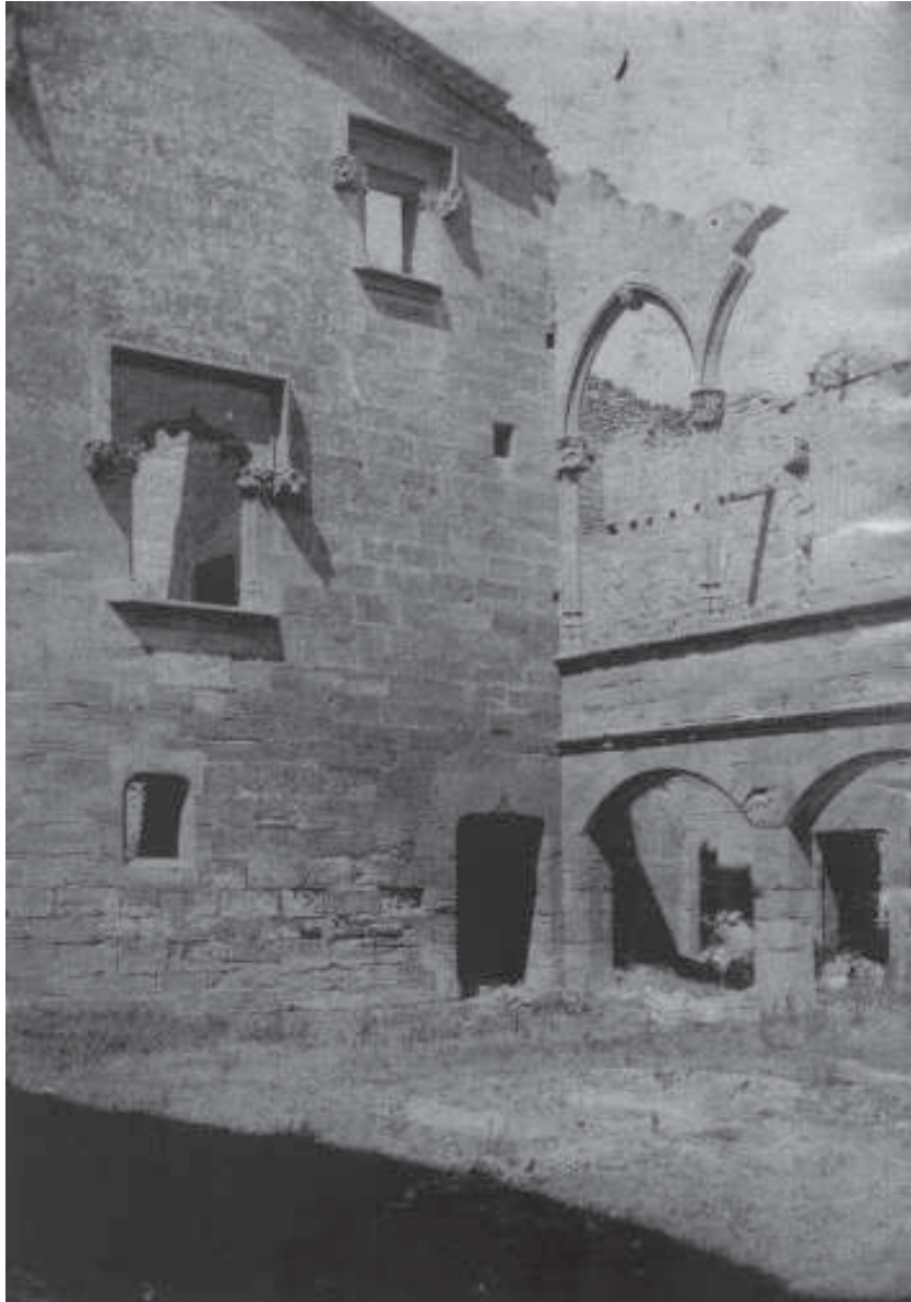
Fotografia del Tallat, amb les finestres gòtiques encara al seu lloc original

Aplec de Treballs (Montblanc) 32 (2014): 65-111