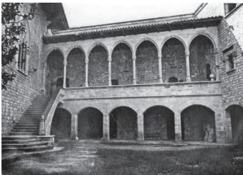
La mateixa galeria, al castell de Santa Florentina, de Canet de Mar