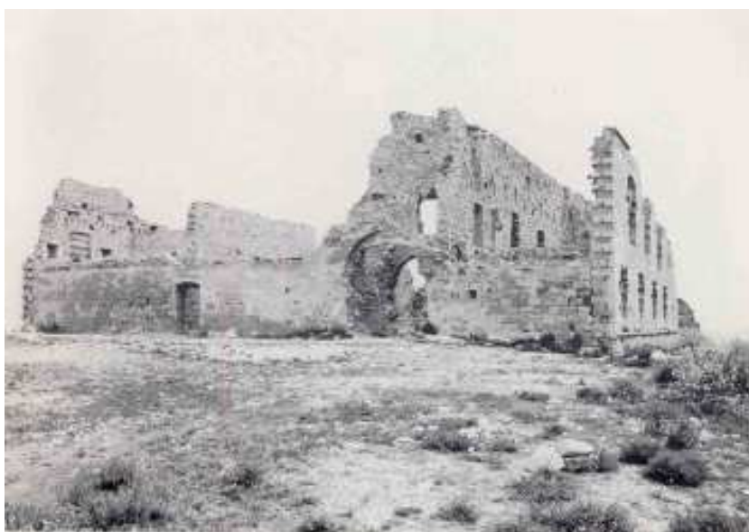
El Santuari del Tallat, l'any 1982