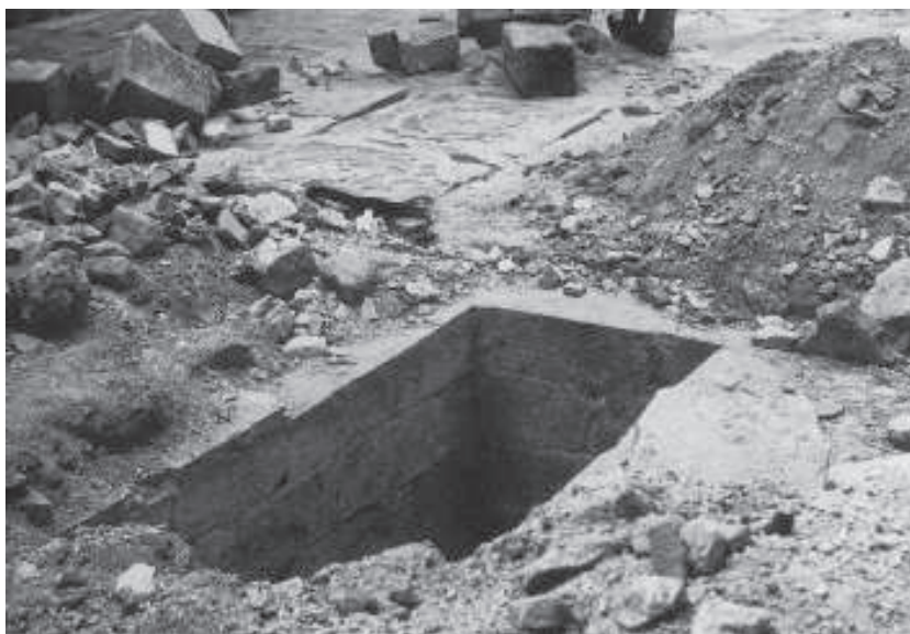
Trobada de la sepultura dels Llorac a l'església del Tallat (1985)