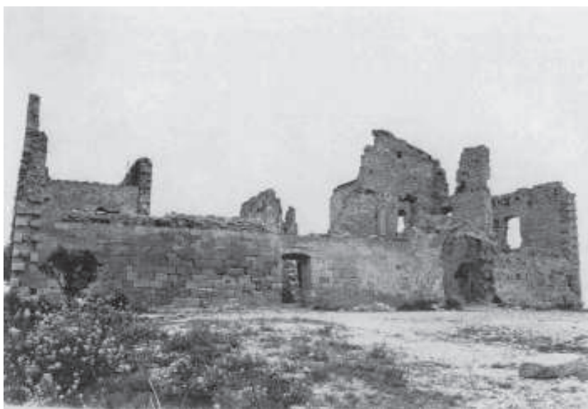
Façana occidental del santuari l'any 1982

Aplec de Treballs (Montblanc) 32 (2014): 65-111