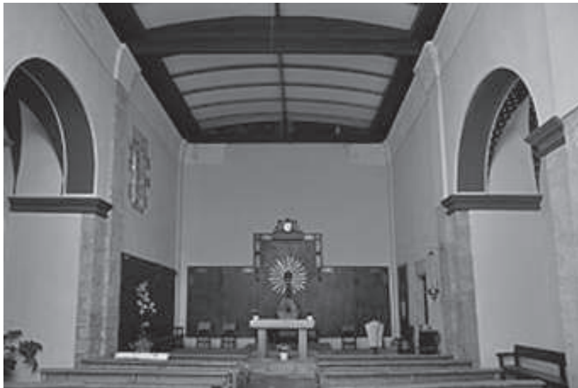
El Tallat. L'església actualment