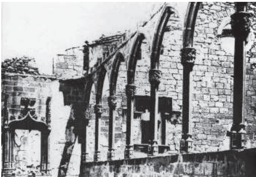
La galeria de la casa del Tallat, a final del segle passat